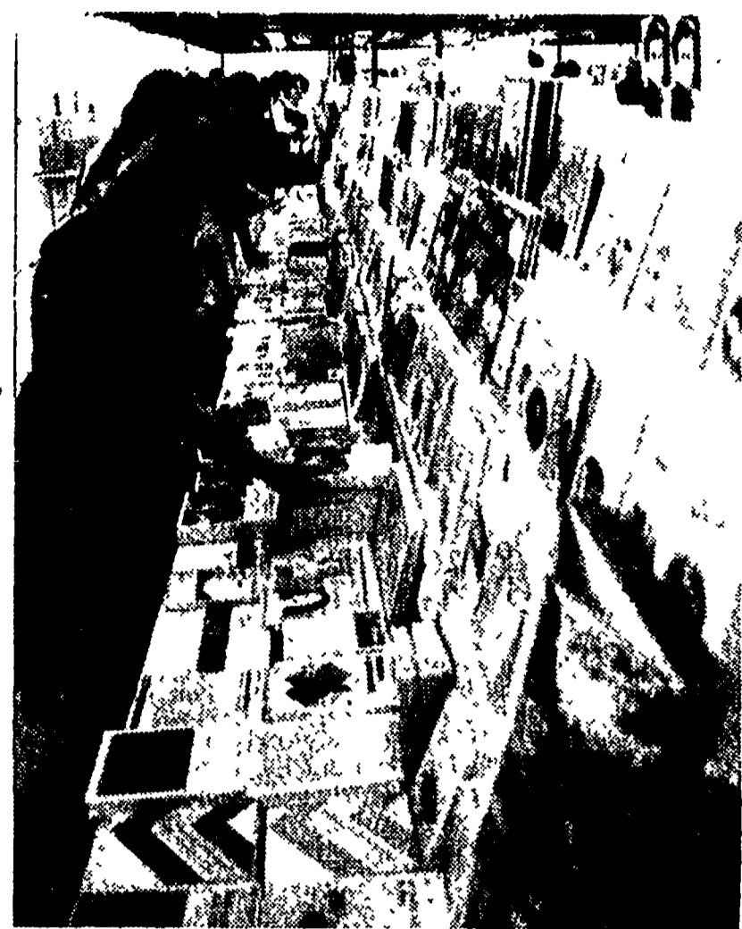
REGGIO EMILIA - Folla tra gli stands e nella libreria del Festival.

Entro stasera si saprà se è possibile riprendere la trattativa