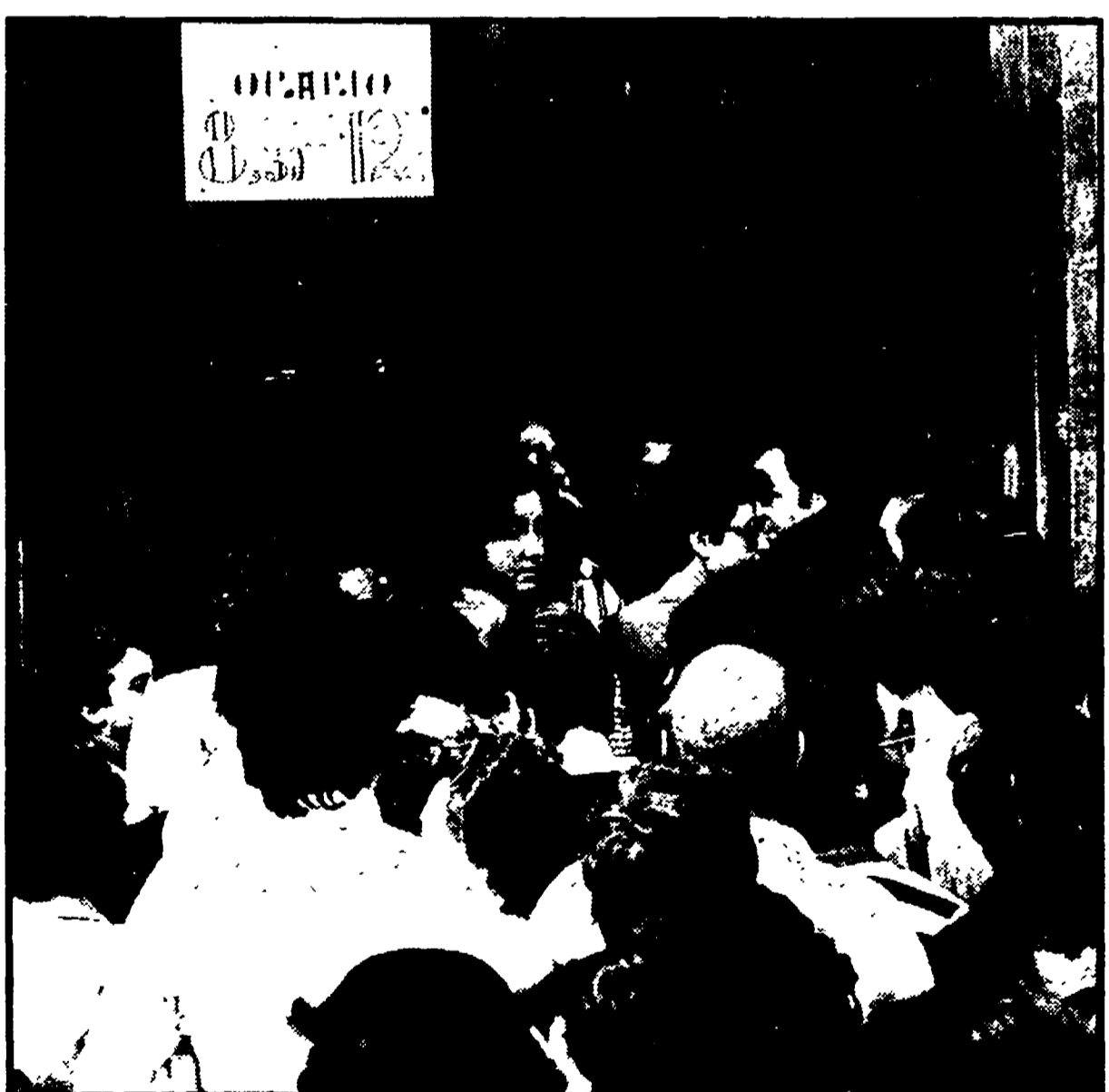
La scadenza del 30 giugno ha provocato, come ormai succede ogni anno, lunghissime file davanti ai portoni degli uffici delle imposte dirette, in via della Conciliazione. Anche ieri mattina (come si vede nella foto) la gente è accalata non solo nei momenti di nervosismo. Gli sportelli sono stati aperti alle 8 del mattino e rispetto al normale orario d'ufficio. Si prevede, però, che per sabato prossimo (tenendo conto dei molti ritardatari) gli uffici prolungheranno l'orario di lavoro

Solita fila degli ultimi giorni per i tanti che devono ancora «pensare» alle tasse