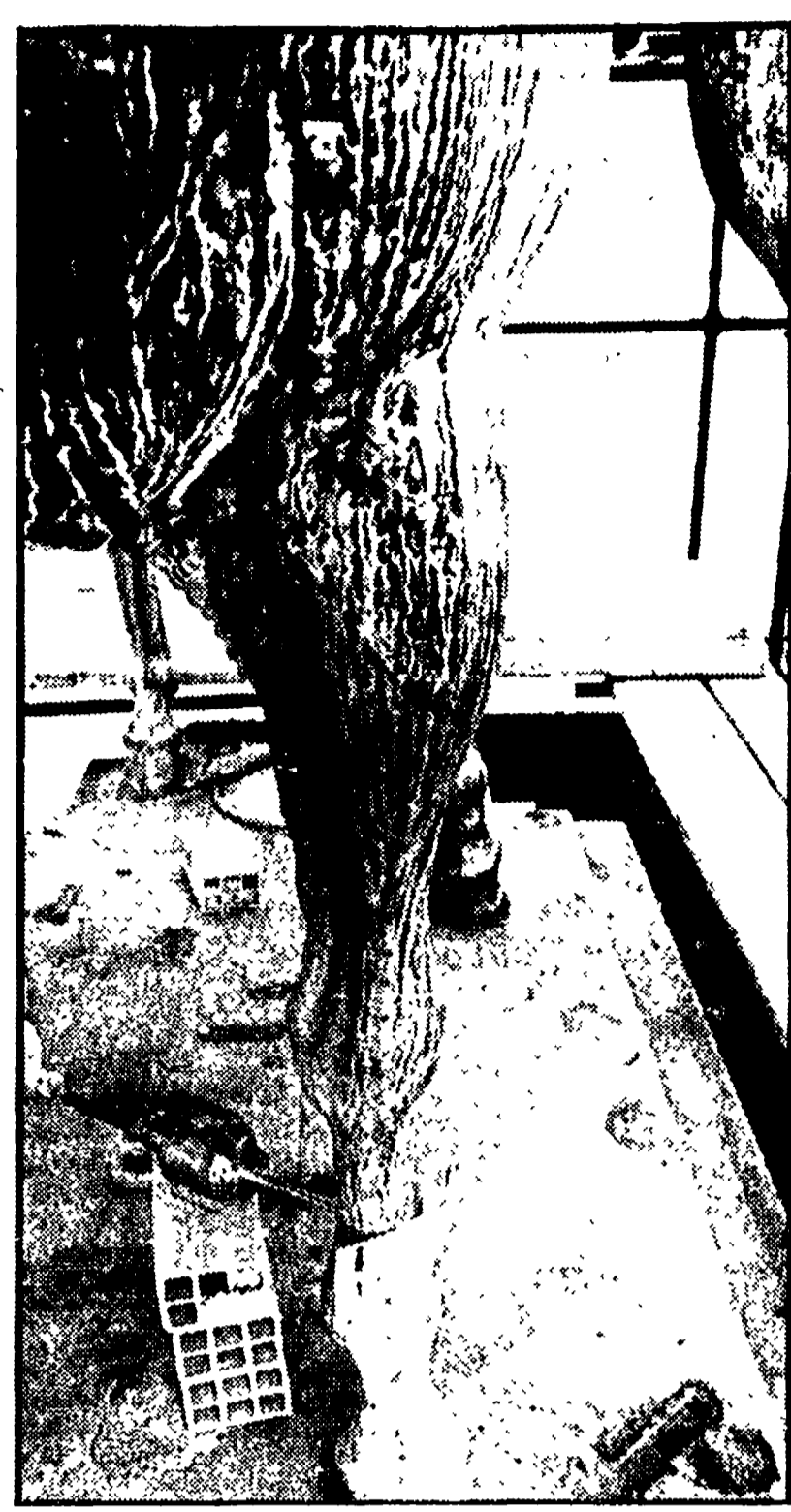
Nella foto: il piedistallo del Marc'Aurelio.

La prognosi si conoscerà solo alla fine del mese. Già da ora, però, si sa che le zampe del cavallo che regge il Marc'Aurelio, sono malate. La celebre statua del Campidoglio, un po' il simbolo di questa città, è da tempo lesionata e si teme addirittura che l'intera statua del monumento sia compromessa.