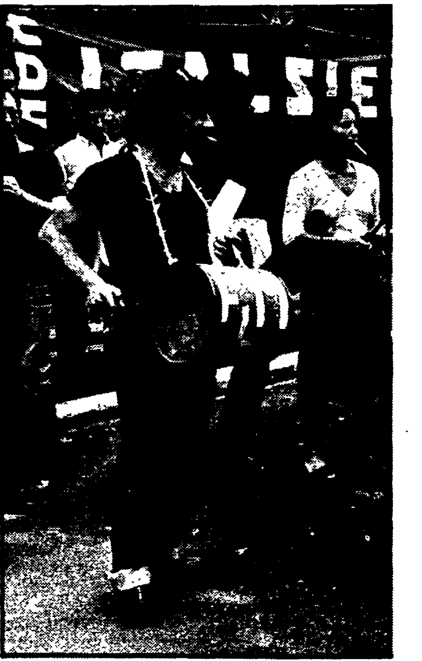
Un particolare della manifestazione dei metalmeccanici davanti alla sede centrale della Stet

Una presenza insolita, in una strada, in un quartiere tutto e solo ufficio, dove la gente è «in transito». I metalmeccanici, quelli delle aziende a partecipazione statale sono venuti fino al suo Corso d'Italia.