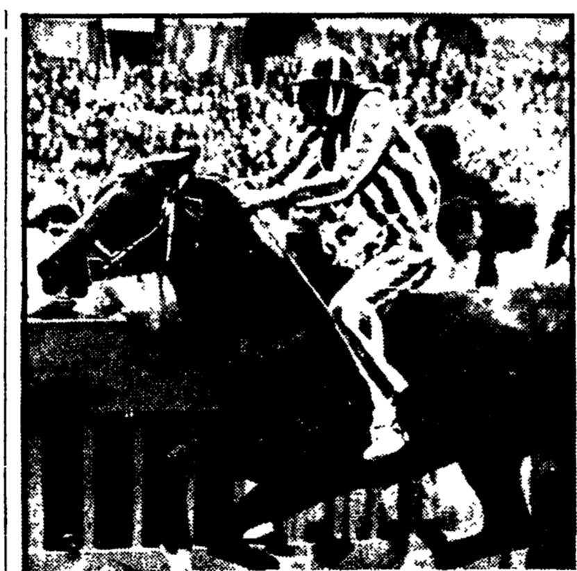
Il cavallo dell'Istrice al gran galoppo

la compagnia teatrale «Lo Sberleffo» e, sempre alle 21.30 alla tendopoli proiezione di un film. Allo stadio comunale di Poggibonsi, per oggi alle 21 e 30: al palco centrale spettacolo teatrale con Livia Cerini che presenta «Mi riunisco in assemblea»; allo spazio proiezione del film «Alle soglie della vita» e, allo stand politico, serata dedicata al tesseramento alla FGCI.