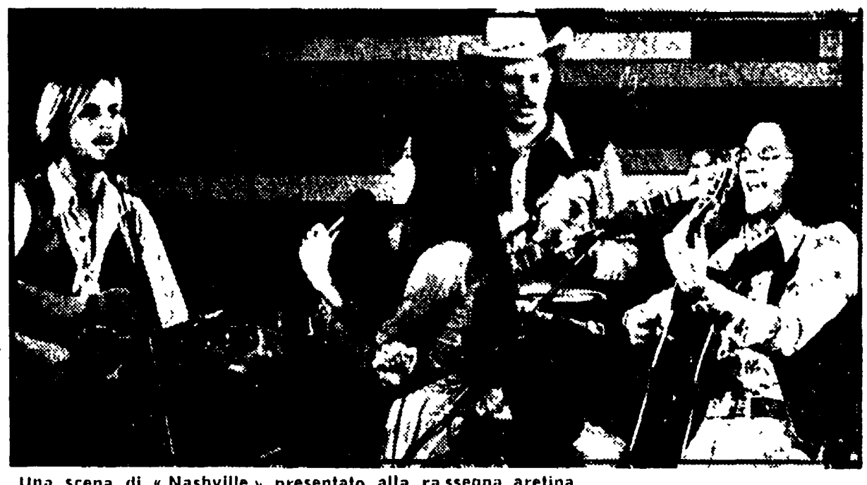
Una scena di «Nashville» presentata alla rassegna aretina

L'ARCI ha concluso domenica la sua rassegna «Il sipario strappato». Una commedia con una rassegna cinematografica all'aperto.