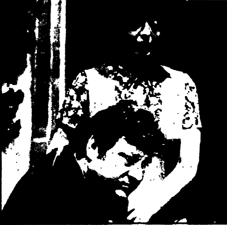
Il cre della sceneggiata napoletana, Mario Merola

Evidentemente Lyndsay Kemp in Versilia ha lasciato il segno: non contento di aver riscosso successo e consensi nell'esibizione tenuta ai primi di luglio, il mimo inglese è tornato ieri sul palcoscenico di Bussoladomani a strappare altri applausi. Ancora con «Flowers», la pantomima tratta da «Nostra Signora dei Fiori» di Jean Genet. Per due sere (stasera e domani) «Divina» animerà il tendone di Bussoladomani con la struggente storia della sua diversità.