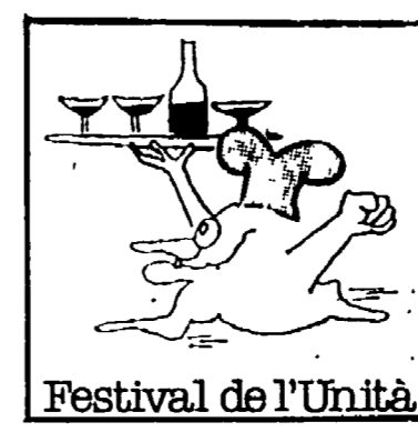
Festival de l'Unità