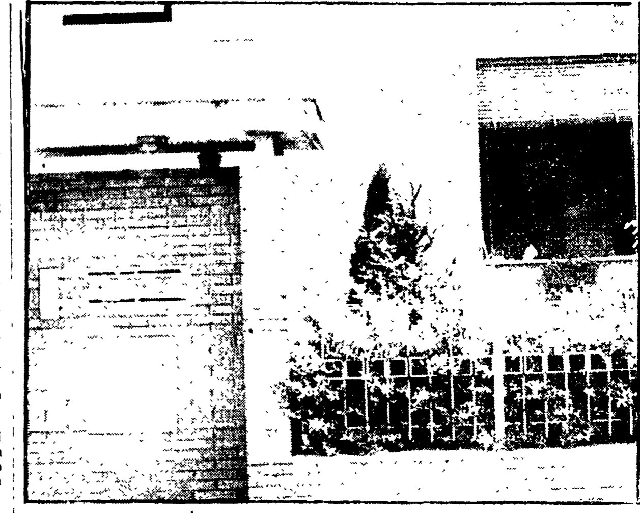
La casa del delitto. Accanto al titolo uxoricide e la moglie uccisa