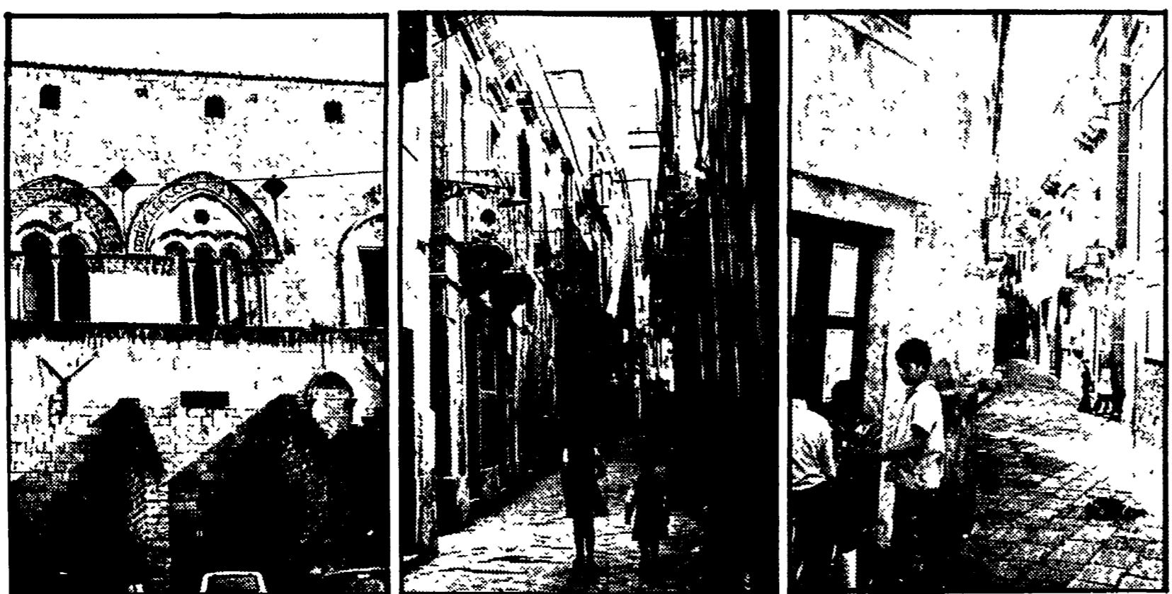
Palazzo Montalto e due vicoli caratteristici di Ortigia, l'antico quartiere di Siracusa

Dai primi nuclei abitativi del secolo VIII a.C. - La battaglia di Italia Nostra - I ritardi dell'amministrazione comunale per il Piano Particolareggiato - Il rischio di interventi « astratti »