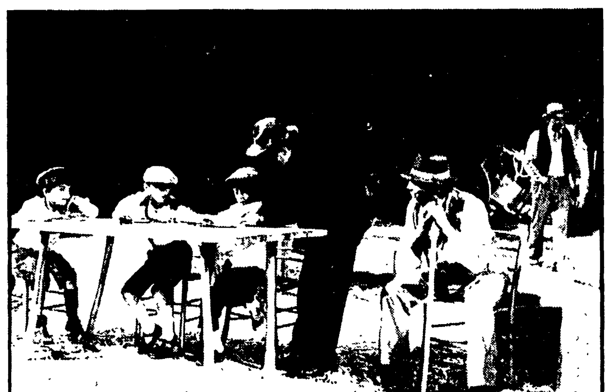
Gli attori del Teatro povero di Monticchiello in una scena di «Due»

MONTICCHIELLO — Cambiano le persone, le cose, le situazioni: restano i problemi, gli stessi. I problemi sono quelli della coppia, del vivere insieme uomo donna. E' questo, in fondo, il senso dell'autodramma rappresentato dalla gente di Monticchiello, un piccolo paese della Val d'Orcia racchiuso tra mura antiche e un tempo feudalesimo castello della Repubblica Senese, tanto da recare ancora, a sinistra della porta principale che immette nella città, lo stemma bianco e nero della «balzana».