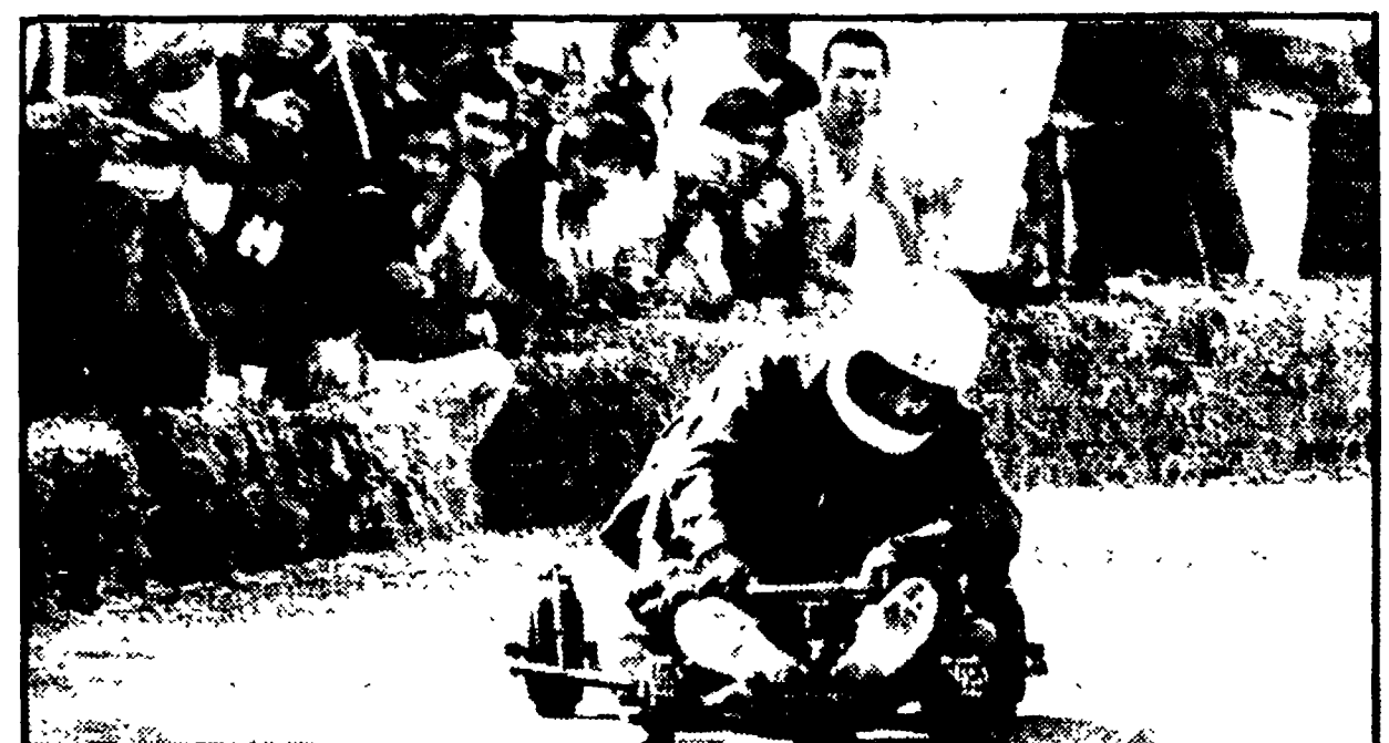
Un carretto, tanta fantasia e sono ad Indianapolis

Regole ferree nella costruzione dei monoposto e dei biposto - A metà fra l'artigianale e il prototipo - Velocità elevate nelle discese