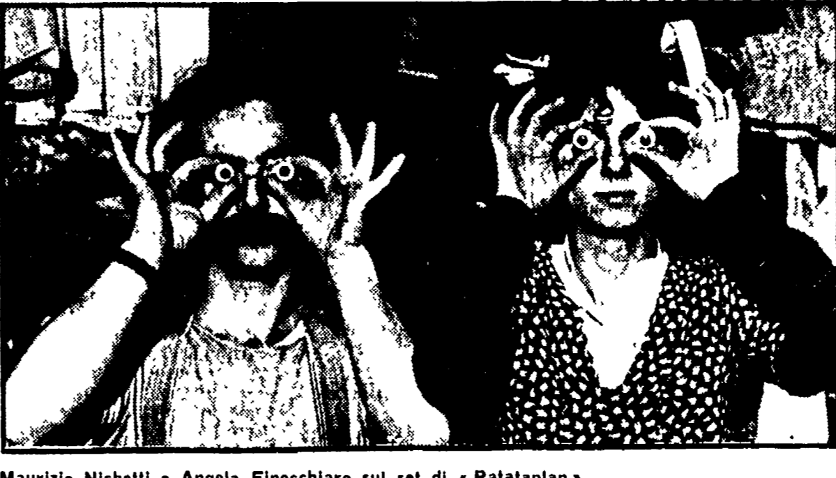
Maurizio Nichetti e Angela Finocchiaro sul set di «Ratataplan»

Un film favolistico dedicato alla generazione della creatività e del privato. La ricerca umoristica condotta attraverso le situazioni anziché i dialoghi