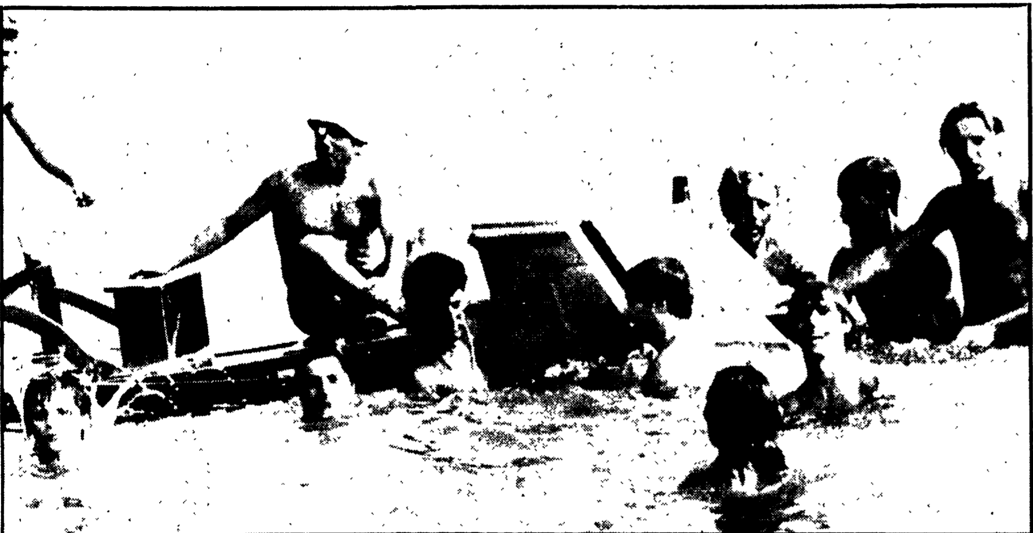
Dopo l'incidente alcuni bagnanti hanno raggiunto l'aereo semisommerso (si nota il timone di coda)