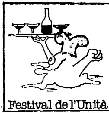
Festival de l'Unita'

la deputazione del Monte dei Paschi che si riuniranno il 10 prossimo, per decidere sull'argomento, specifico, di mantenere fermo l'impegno a suo tempo assunto dagli istituti di credito, per il quale si è battuto anche il nostro Partito. Non vogliamo perdere quella parte della collaudata fiducia che per la soluzione di questo problema ancora ci rimane e mentre manteniamo fermo il nostro impegno politico siamo convinti che anche le altre forze faranno il loro dovere verso un problema così grave per la Maremma. Frattanto il consiglio di amministrazione dell'ANAS è convocato per il 3 settembre. In quella occasione si ritiene che si provvederà a dare il via alla pratica realizzazione dell'ammendamento della statale Aurelia tra Braccagni e Follonica.