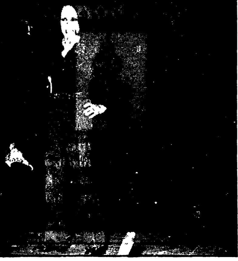
Milly durante un'esibizione

ore 21,30 - film per ragazzi «Dudù il magliolino scatenato». LUNEDÌ 13 AGOSTO Ore 21 - concerto della Banda Città del Palio; segue ballo con il complesso Quinta Dimensione; ore 21,30 - spazio dibattito: dibattito su «La violenza sessuale»; ore 21,30 - spazio cinema-musica-teatro: film «Il fantasma della libreria» di Luis Buñuel; ore 21,30 - film per ragazzi: «Il principe, il giocoliere e il gigante». MARTEDÌ 14 AGOSTO Ore 21 - palco centrale: dibattito sul tema: «Casa e urbanistica: il ruolo dei comuni e della regione»; segue ballo con i Romantici; ore 21,30 - spazio cinema-musica-teatro: film «Sofia» di Andrej Tarkovskij; ore 21,30 - film per ragazzi «Le nuove avventure di Furio». MERCOLEDÌ 15 AGOSTO Ore 17 - grande tombola di lire 300.000; ore 21 - ballo popolare con il complesso Livello 7; ore 21,30 - spazio cinema-musica-teatro: film «Tragic bus» di Bay Okany; ore 21,30 - film per ragazzi «Beniamino». GIOVEDÌ 16 AGOSTO Ore 21 - ballo popolare con gli scozzesi del liceo; ore 21,30 - spazio cinema-musica-teatro: film «Dracula padre e figlio» di Molinaro; ore 21,30 - film per ragazzi «Gli anni in tasca». VENERDÌ 17 AGOSTO Ore 21 - palco centrale: tavola rotonda su «Energia, ambiente e sviluppo»; segue ballo con i Kriminali; ore 21,30 - spazio cinema-musica-teatro: concerto del Quintetto d'archi di Milano; ore 21,30 - film per ragazzi «Sulle ali dell'arcobaleno».