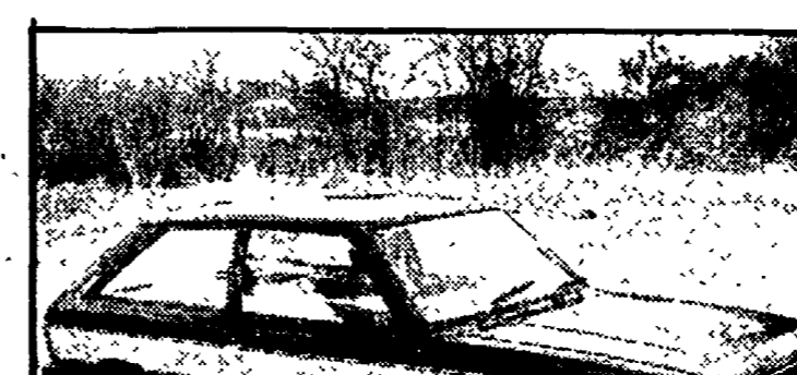
La Sunbeam è diventata la seconda vettura per importanza nel mercato delle importazioni della Chrysler-Italia...