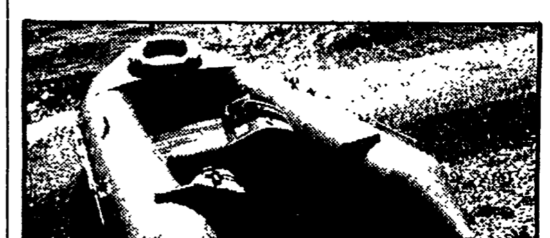
Tempo di vacanza, tempo di sport. Per la maggioranza degli italiani che le vacanze possono fare, i mesi estivi coincidono infatti con l'unico periodo dell'anno in cui è possibile praticare una certa attività sportiva...