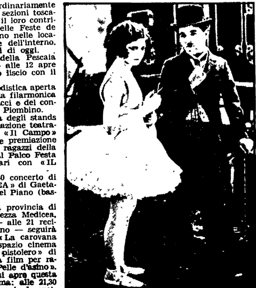
Una scena dell'indimenticabile « Il Circo » di Chaplin

Nonostante il clima straordinariamente caldo i compagni di numerose sezioni toscane del Pci continuano a dare il loro contributo per la buona riuscita delle Feste de l'Unità, sia che esse si svolgano nelle località della costa che in quelle dell'entroterra. Diamo di seguito i programmi di oggi. Alla Festa di Castiglione della Pescaia alle 8 apertura della Festa — alle 12 il ristorante alle 21,30 ballo liscio con il complesso « Gli Amici ». A Donoratico alle 18 gara podistica aperta a tutti; alle 21,30 concerto della filarmonica comunale di Castiglione della Pescaia con il complesso « Gli Amici ». A Follonica alle 12 apertura degli stands — alle 18,30 spettacolo di animazione teatrale « Sul Pilo » con il gruppo « Il Campo » di Montecatini. A Massa alle 21,30 premiazione di disegni su tema libero dei ragazzi della scuola dell'obbligo — alle 21 al Falco Festa spettacolo di canzoni popolari con « IL GRUPPO » di Lucca.