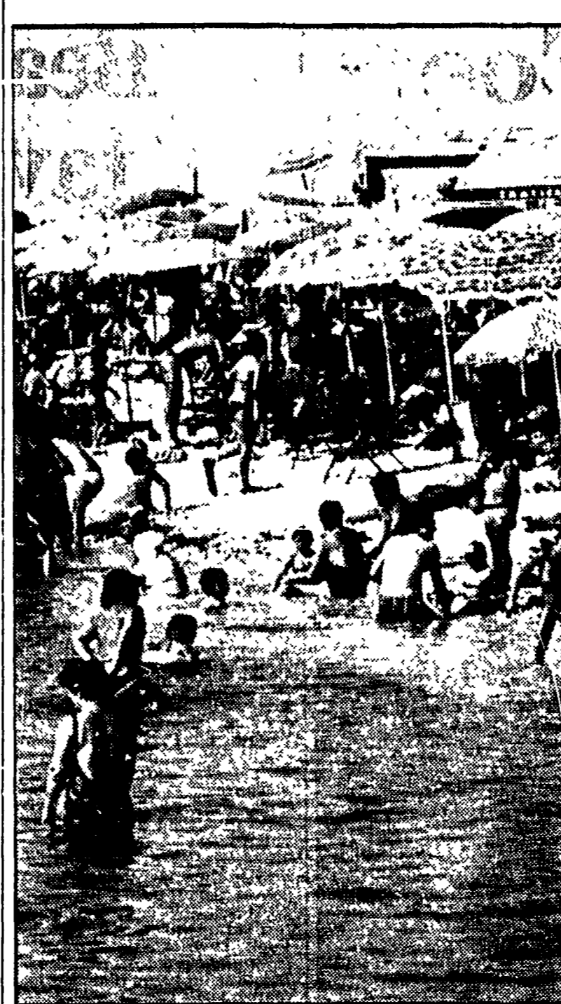
Gran folla di bagnanti nelle spiagge del Conero