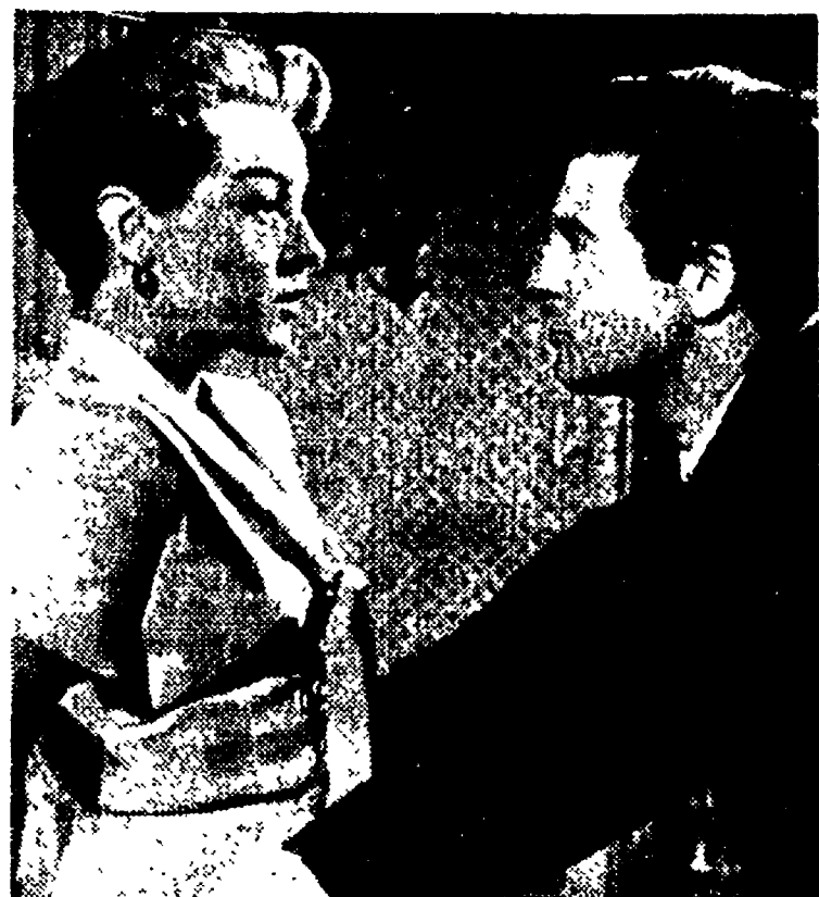
I protagonisti de « I peccatori di Peyton » in una scena del film in programma sabato

La « Nuova compagnia » a Castel S. Angelo - Sabato in programma c'è anche una corsa podistica a Ostia