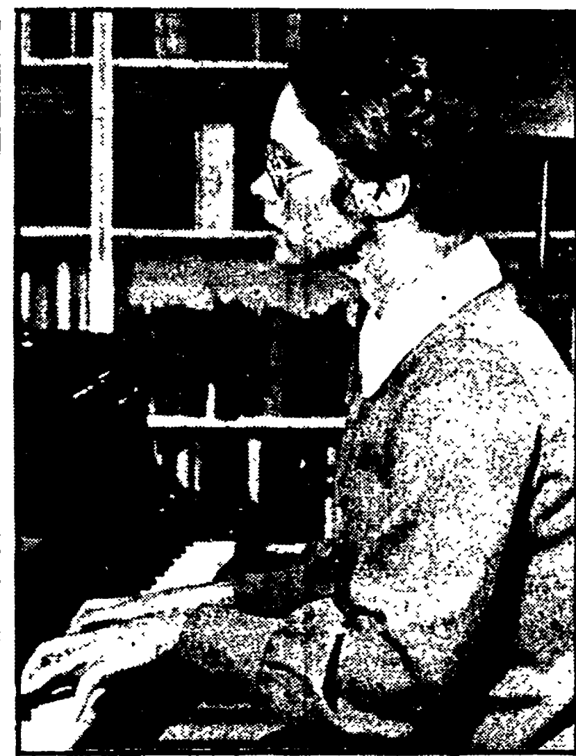
Un fotogramma del film «Sinfonia d'autunno» di Bergman