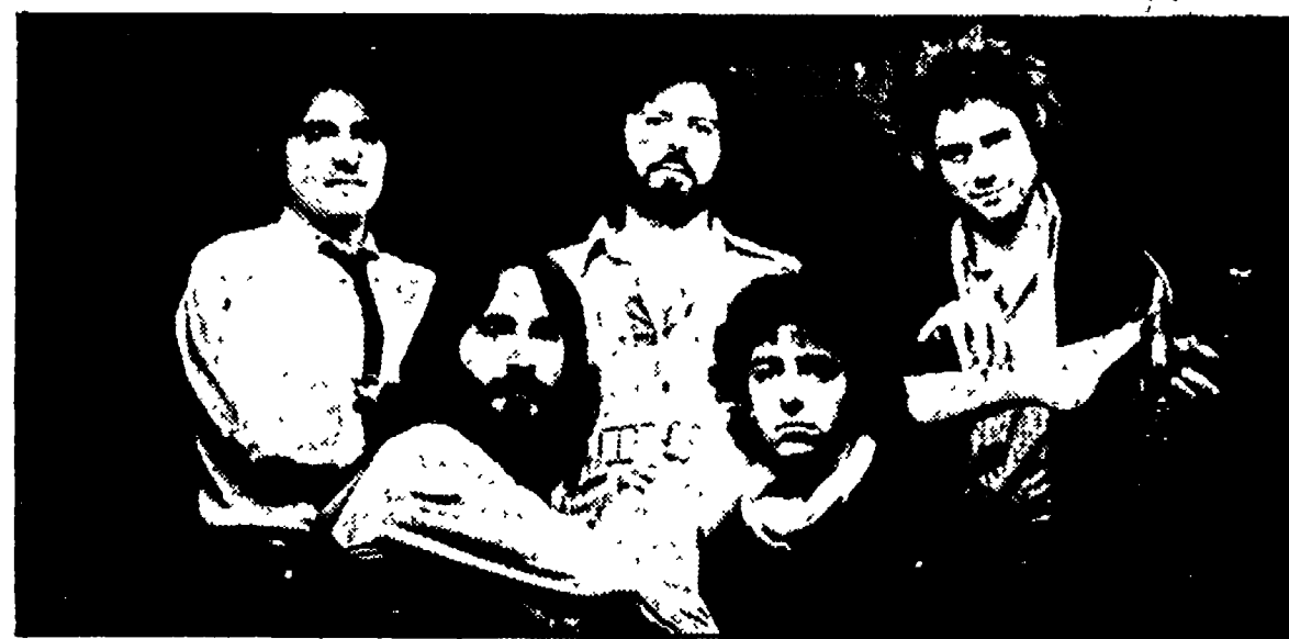
La Premiata Forneria Marconi.