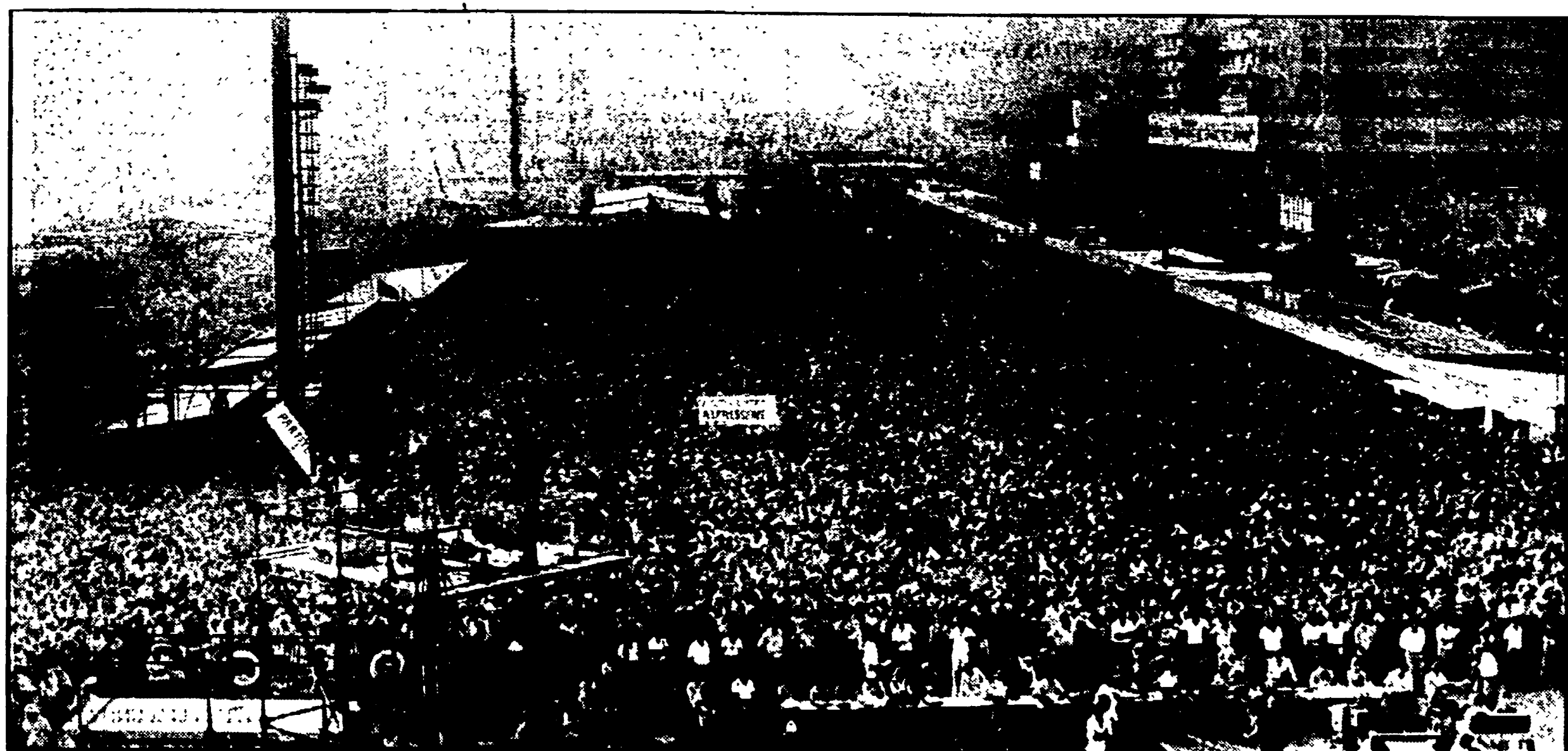
La grande folla del comizio di chiusura alla Festa nazionale dell'«Unità» di Genova.