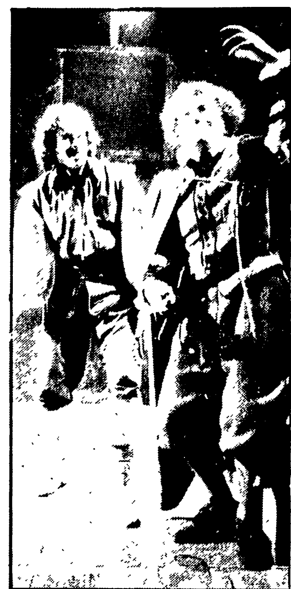
Una scena da « L'illusion comique ».