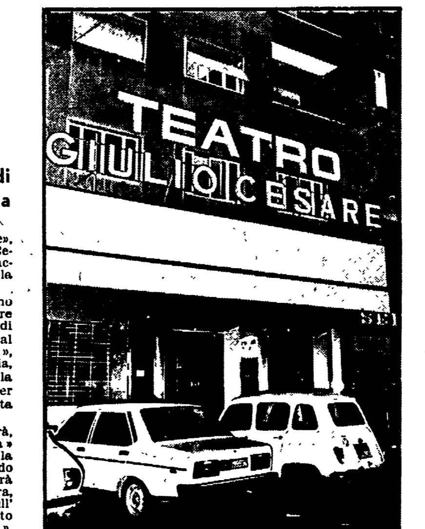
Il teatro Giulio Cesare.