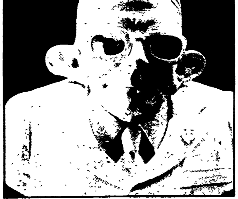
Il «Maligno» busto di Andreotti

Sequestrato il mezzobusto del leader dc che «Il Male» voleva scoprire al Pincio