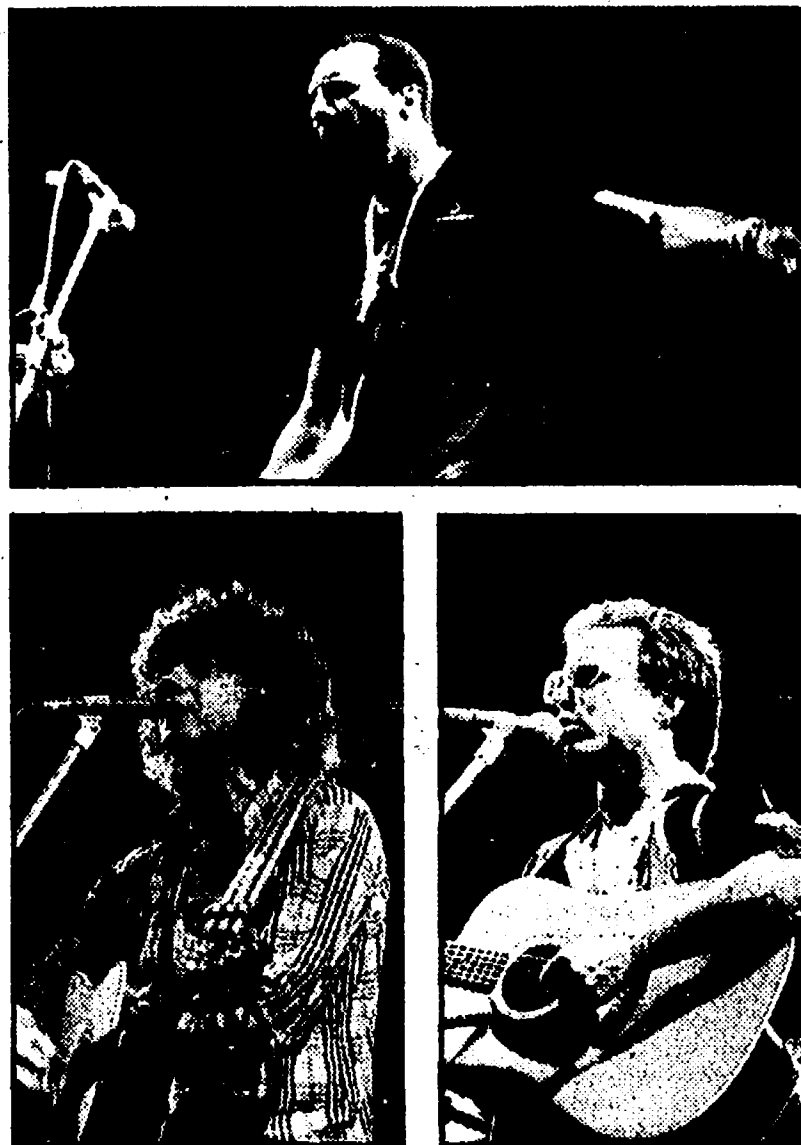
Arlo Guthrie (a sinistra), Country Joe Mac Donald e, nella foto sopra, Richie Havens nella loro tournée italiana.

«No, non credo che si possa cambiare il corso della storia. Ma la storia, ma è la storia che fa le canzoni».