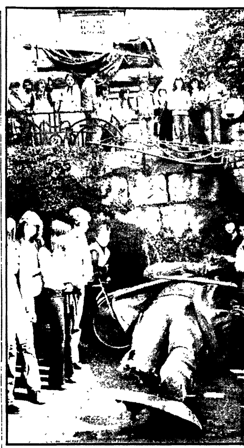
MERANO - Il monumento di Andreas Hofer fatto saltare