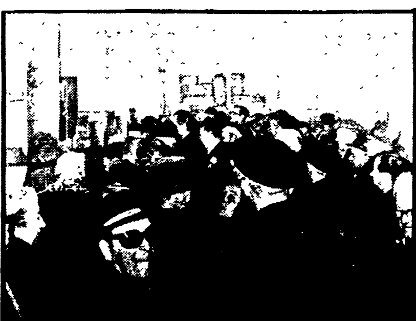
Una riunione di una delle assemblee di massa del PCI.

Ma i sindacati hanno deciso di aprire con il governo la «vertenza fisco».