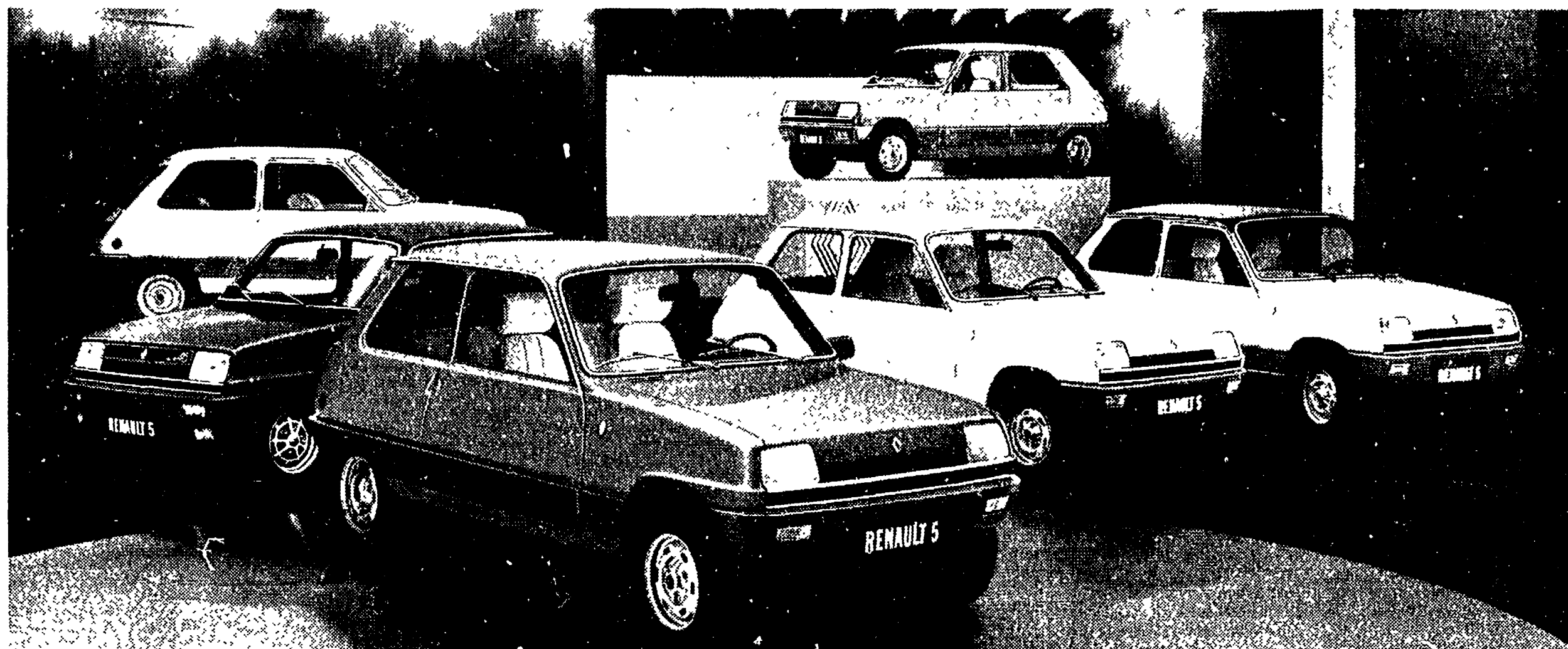
Più bella e attuale che mai, la Renault 5 è oggi disponibile in otto versioni e 5 diverse cilindrate, da 850 a 1400.

La Renault 5 è giovane. E come tutto ciò che è giovane, è in continua crescita, dando una esemplare dimostrazione di grande vitalità e di grande intelligenza.