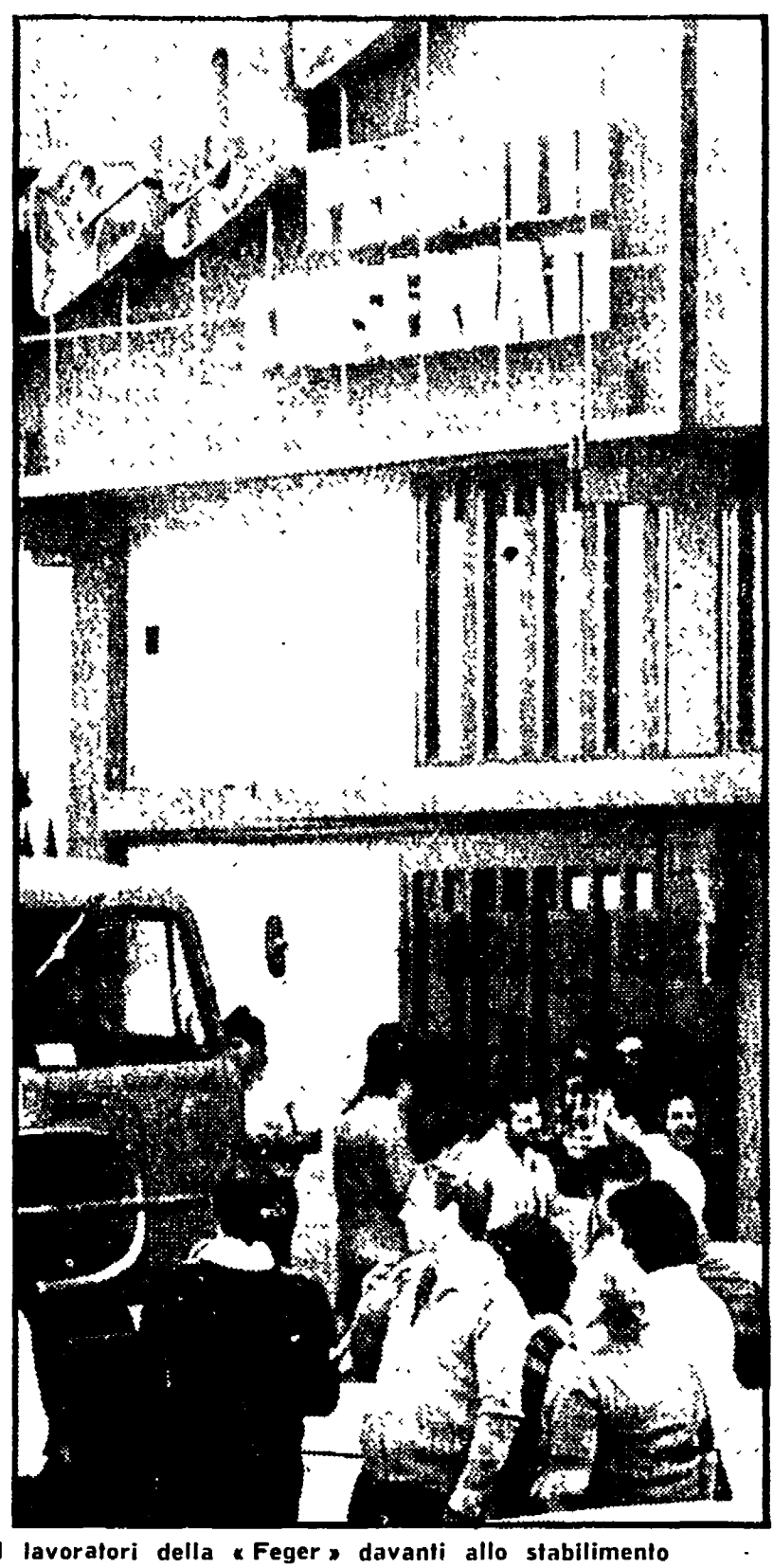
lavoratori della «Feger» davanti allo stabilimento