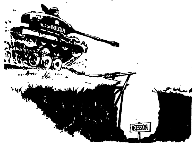
Da U.S. News & World Report