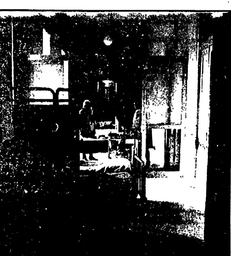
Una corsia del San Camillo

dell'Idroscalo, ma la piscina non è ancora utilizzabile perché manca il collettore di scarico delle acque.