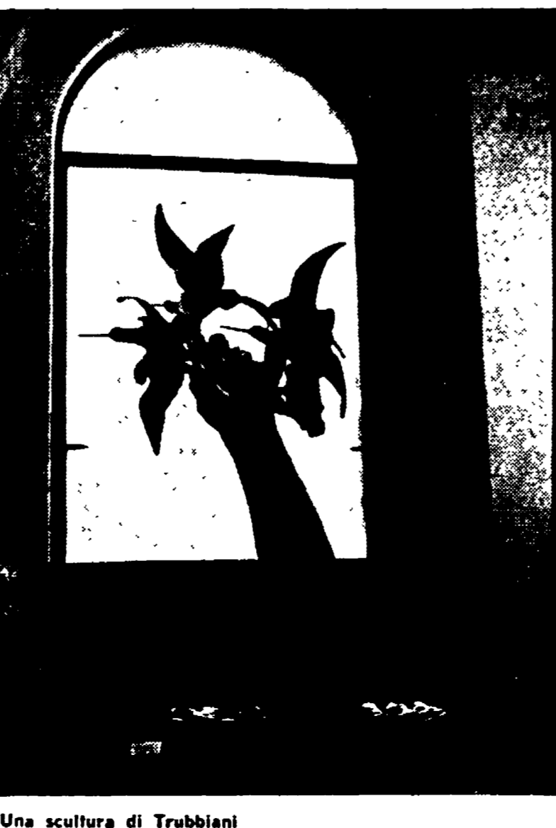
Una scultura di Trubbiani