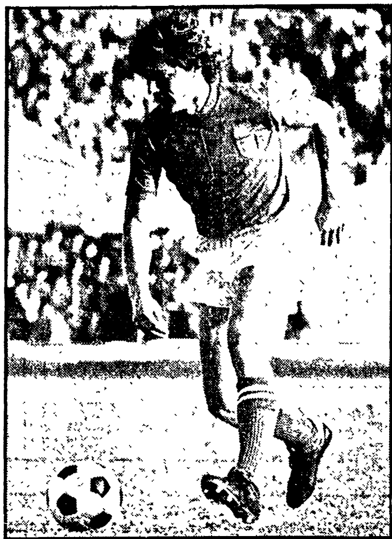
Il capitano Giancarlo Antognoni