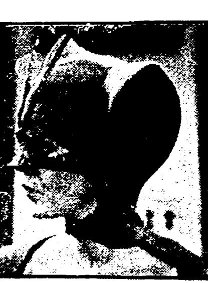
Mindy e Mork, protagonisti del telefilm

una di quelle creature che popolano i nostri teleschermi da anni.