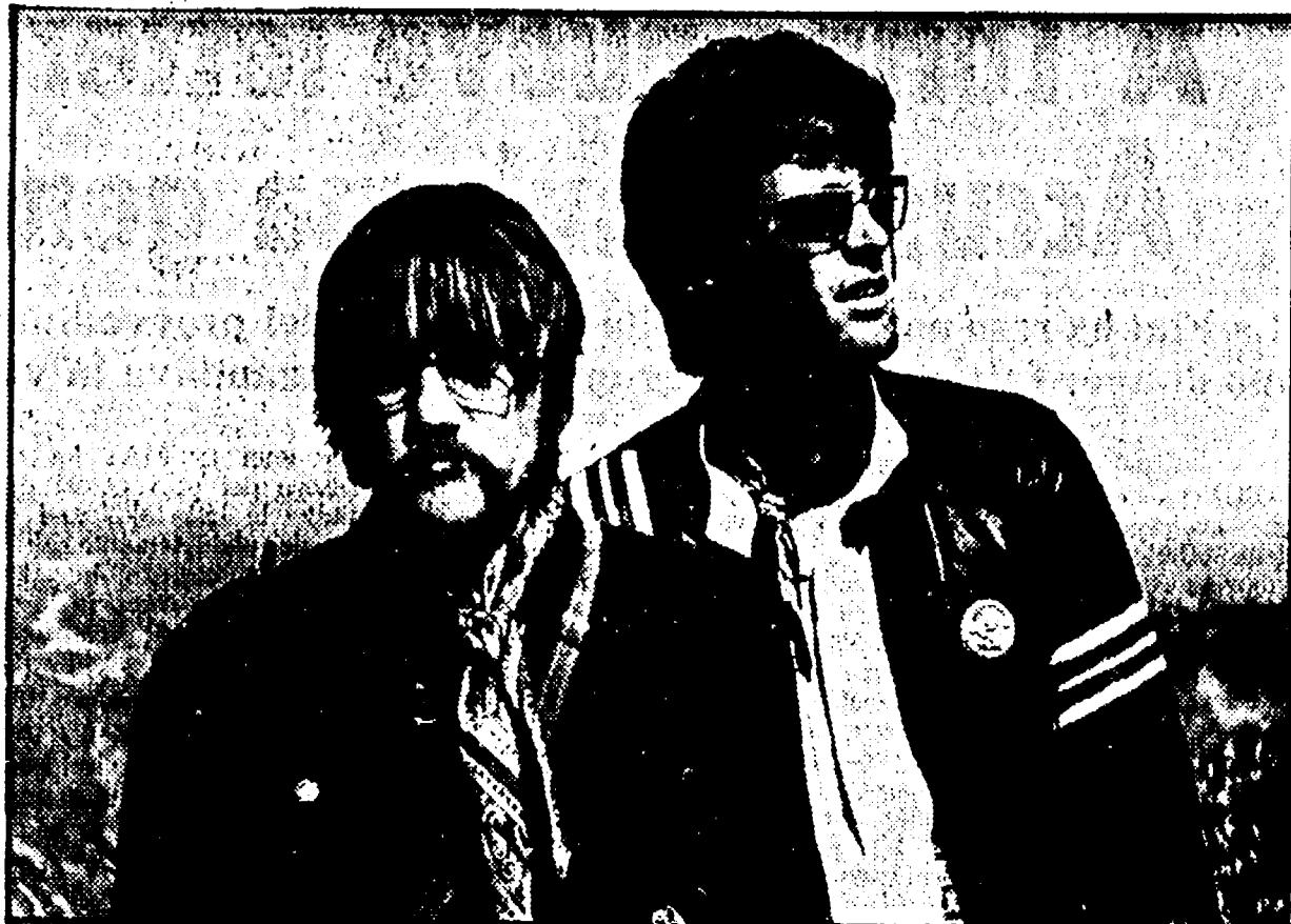
Un'inquadratura di Easy rider, uno dei tanti film ancora esclusi dalle rassegne TV

Il cinema in TV: come nascono i cicli, le difficoltà e la concorrenza delle «private»