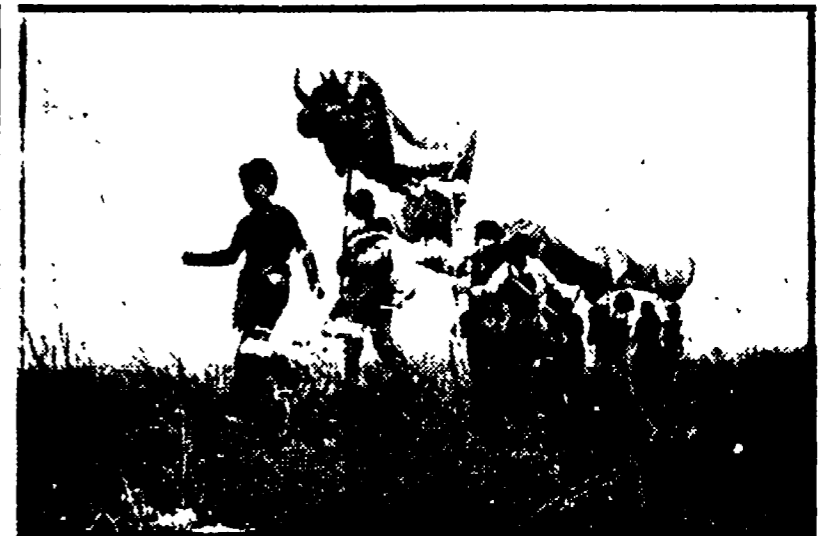
di cartapesta costruito dai bambini di Genova.

Film, giochi, mostre, incontri e dibattiti al Palazzo dei Congressi. S'inaugura alle 10 col sindaco e i presidenti di Provincia e Regione