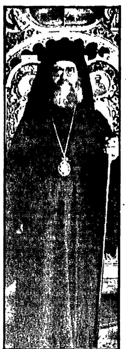
A sinistra, una pianta di Costantinopoli del secolo XVI. A destra, Demetrius I, capo spirituale della chiesa ortodossa orientale.