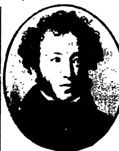
La figura del poeta Puskin è stata rievocata nella polemica fra «Giovane Guardia» e «Komunist».