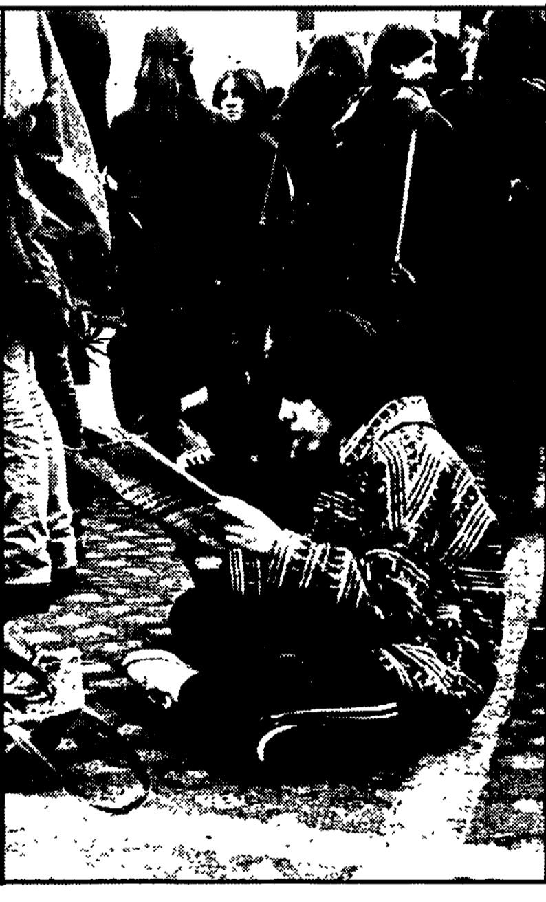
Un momento della manifestazione di ieri mattina alla Camera

«Col di Lana» che coabita con la «Caetani». Si è appunto, quindi, che in questa scuola media vi sono locali utilizzabili (magari a rotazione) attualmente occupati dall'aula di scienze, di musica, dal teatrino, dalla sala cinematografica ecc.