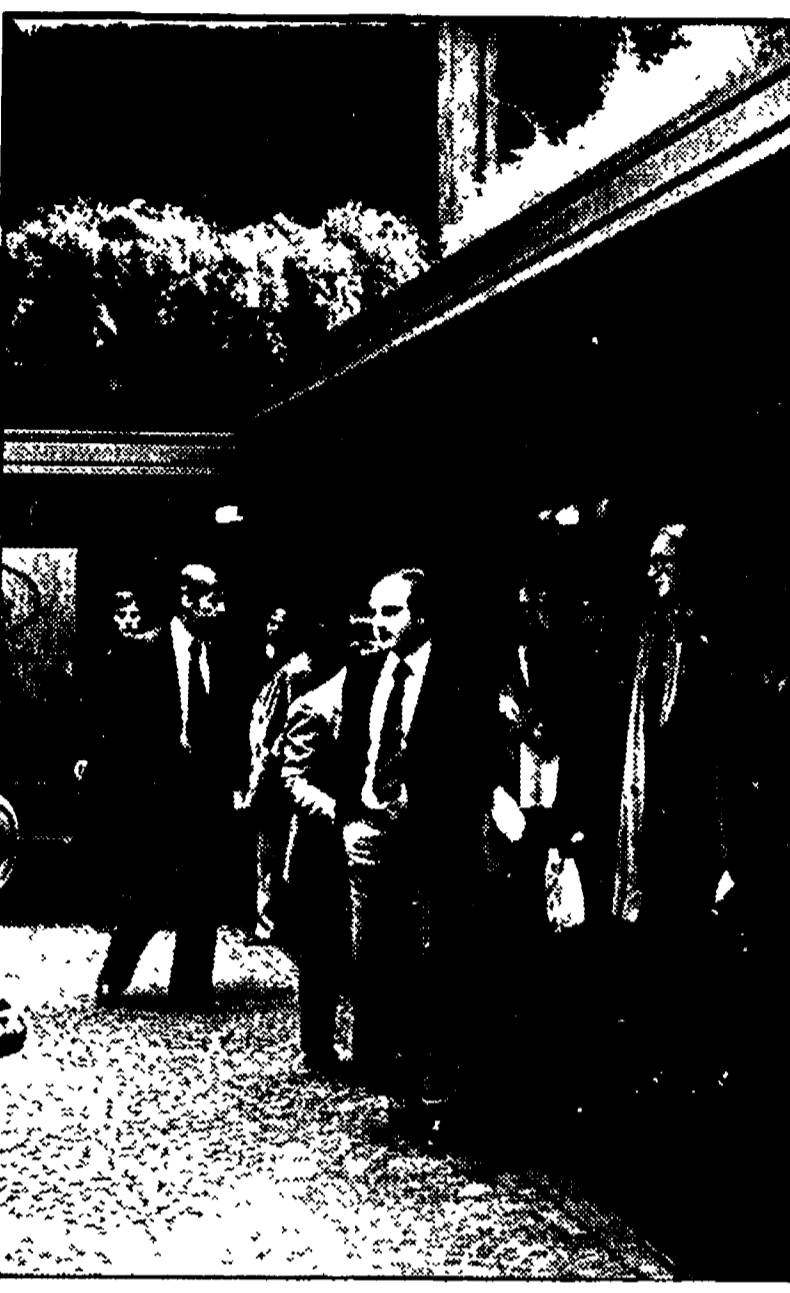
L'ingresso della banca, si intravede Fellini

Il curioso espediente forse è stato suggerito ai rapinatori dalla presenza di Federico Fellini Gigantesca caccia all'uomo (senza successo) per le strade intorno alla zona di piazza di Spagna