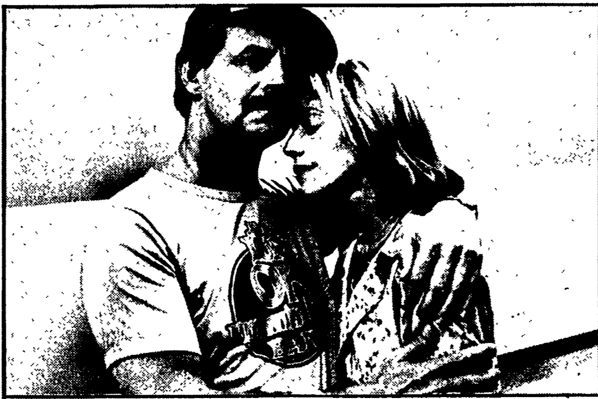
Paul Dooley e Maria Heflin in « Una coppia perfetta » di Altman