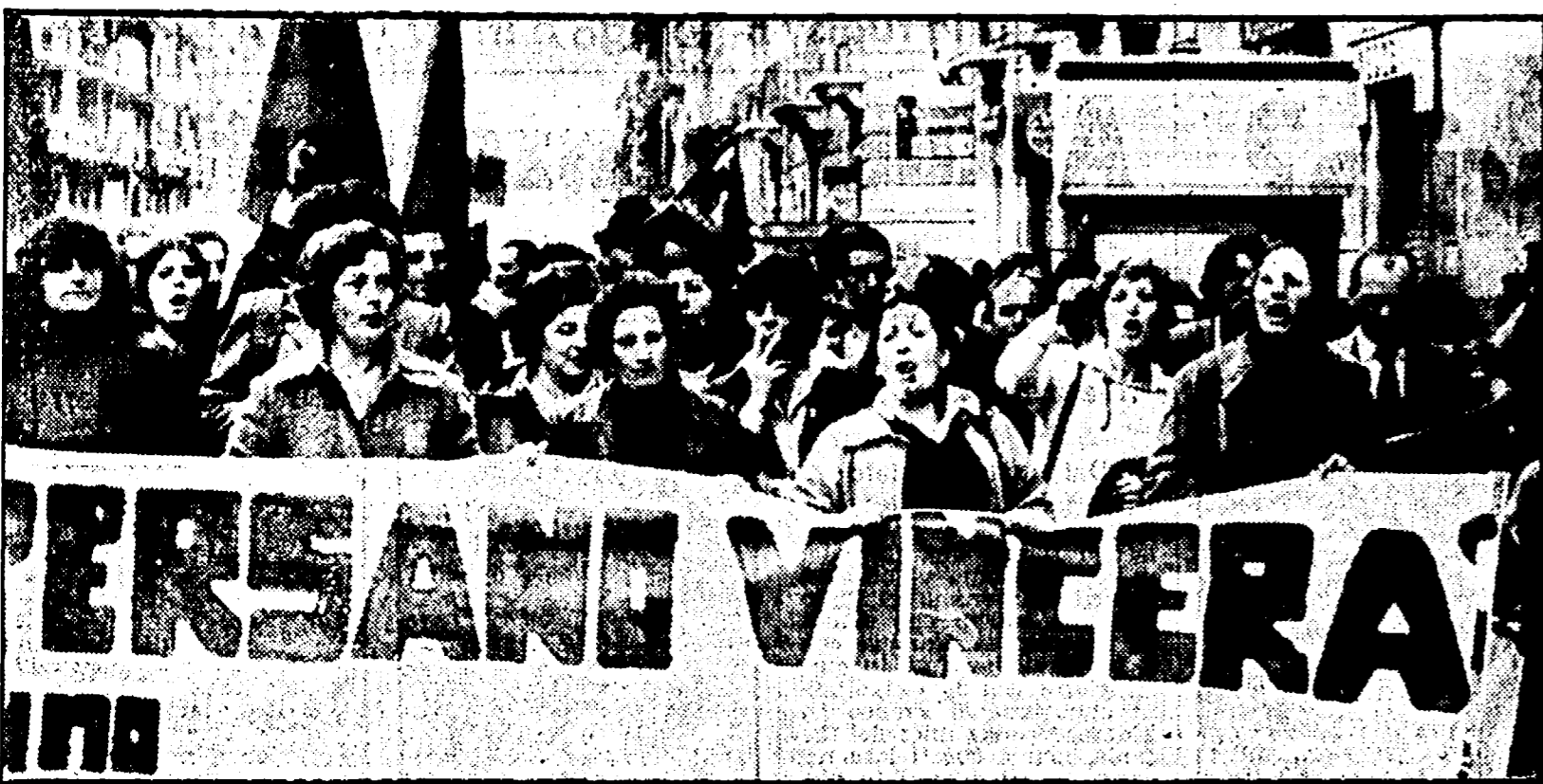
Per l'aggressione del segretario CGIL e del delegato sindacale