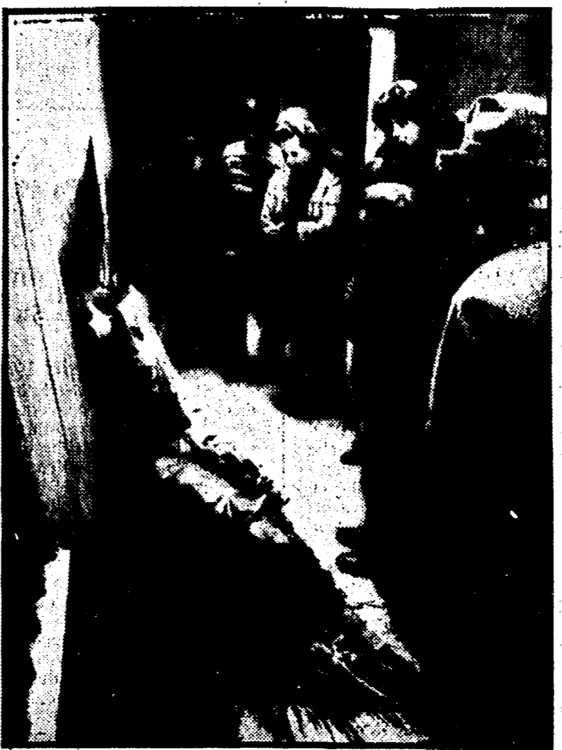
Fiori sul luogo dell'assassinio del maresciallo

Finanza locale: oggi l'incontro dei sindaci di tutta la provincia con Petroselli Si incontrano oggi con il sindaco Petroselli, i sindaci e gli assessori di tutti i Comuni della provincia di Roma. Discuteranno della finanza locale, un tema di scottante attualità sul quale il PCI si è impegnato con forza e sul quale in questi giorni si apre la settimana di lotte e iniziative della Lega regionale per le autonomie locali.