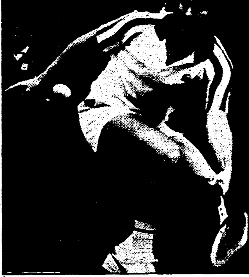
JOHN MCENROE: un gesto di nervosismo gli è forse costato la partita

Risultati: Borg (Sv) - McEnroe (USA): 1-6, 6-1, 6-4; Vilas (Argentina) - Panatta (Italia): 6-4, 6-4; Gerulaitis (USA) - Fleming (USA): 6-1, 6-1; Tanner (USA) - Barazzutti (Italia): 6-2, 6-2.