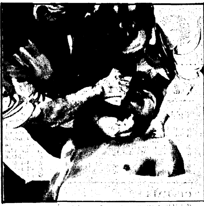
Aveva subito un k.o. a New York