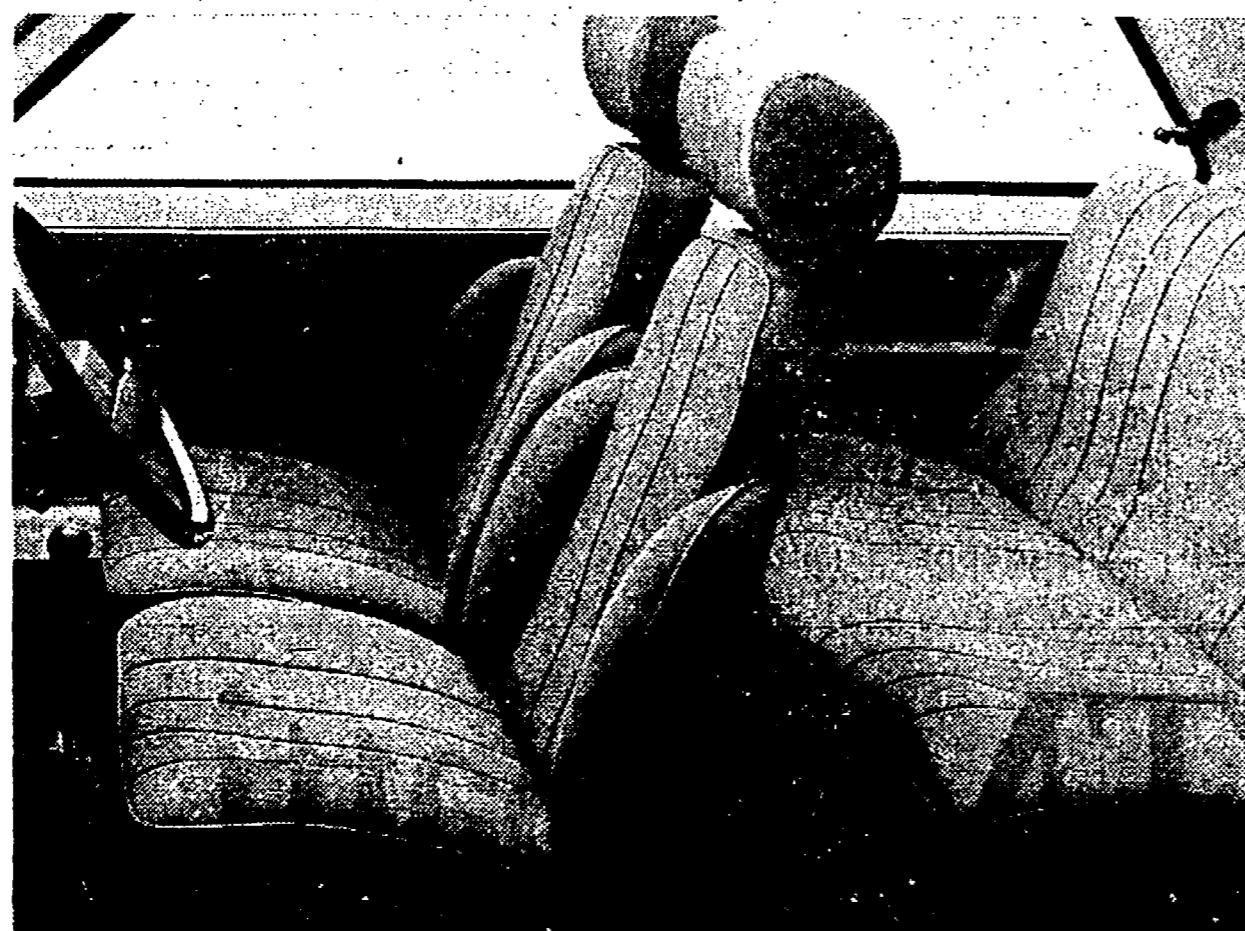
I nuovi sedili, completamente ridisegnati, sono un esempio di eleganza e funzionalità.