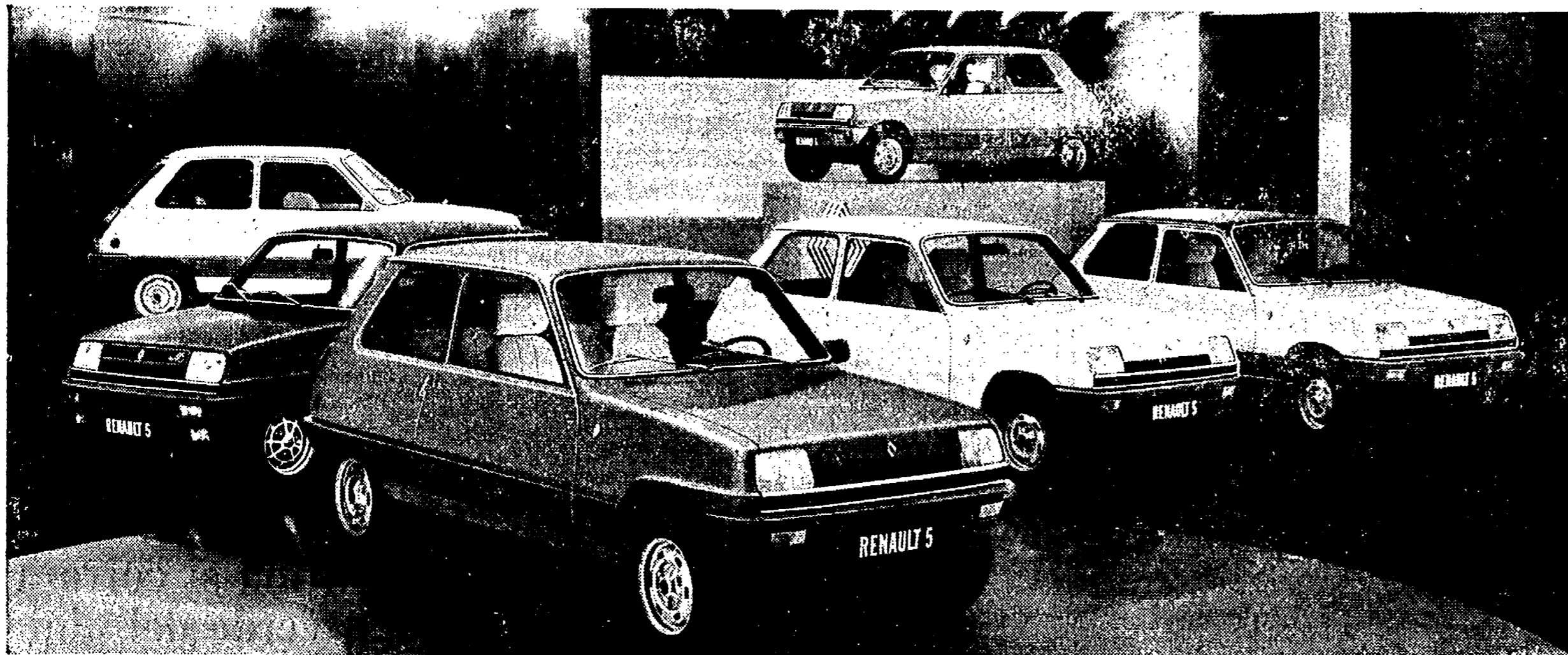
Più bella e attuale che mai, la Renault 5 è oggi disponibile in otto versioni e 5 diverse cilindrata, da 850 a 1400.