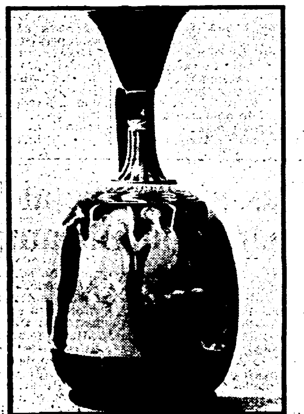
Un vaso greco ritrovato in Bulgaria

SOFIA - Frammenti di un imponente statua di bronzo di un imperatore romano della fine del II secolo, la base di un antico edificio, incendiato e distrutto, sulle cui rovine in epoca posteriore fu costruita una basilica cristiana, sono stati ritrovati da una spedizione scientifica bulgaro-polacca poco lontano da Svishtov, sul Danubio. La spedizione sta lavorando da vent'anni alla ricerca dell'antica città di Novae. Si presume che la statua, che doveva essere alta due metri, raffigurasse uno degli imperatori della dinastia dei Severi.