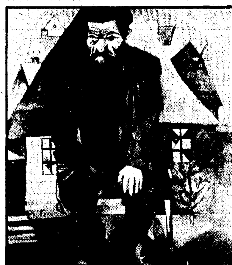
«L'ebreo rosso» un dipinto di Marc Chagall