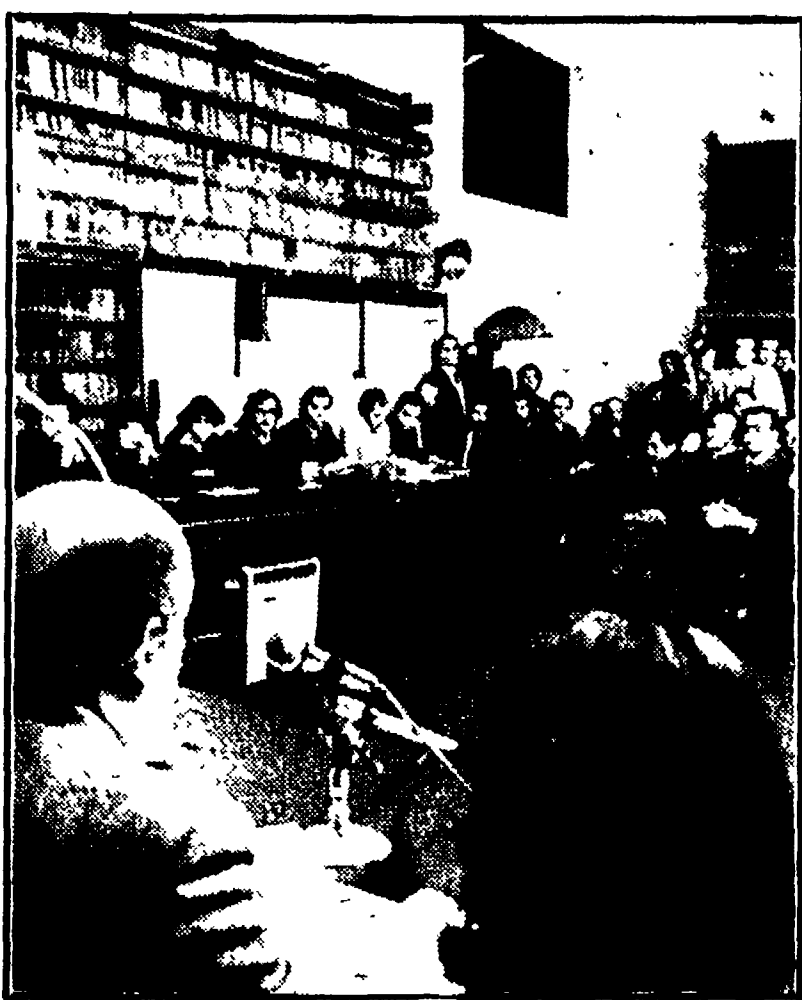
L'assemblea di insediamento del quartiere 1 nel '78

Come funziona la macchina del decentramento amministrativo. A colloquio con i protagonisti di questa esperienza - La conferenza cittadina e l'iniziativa del PCI - C'è chi parla di delusione, chi prepara il lavoro futuro delle deleghe. La crisi delle pubblica amministrazione