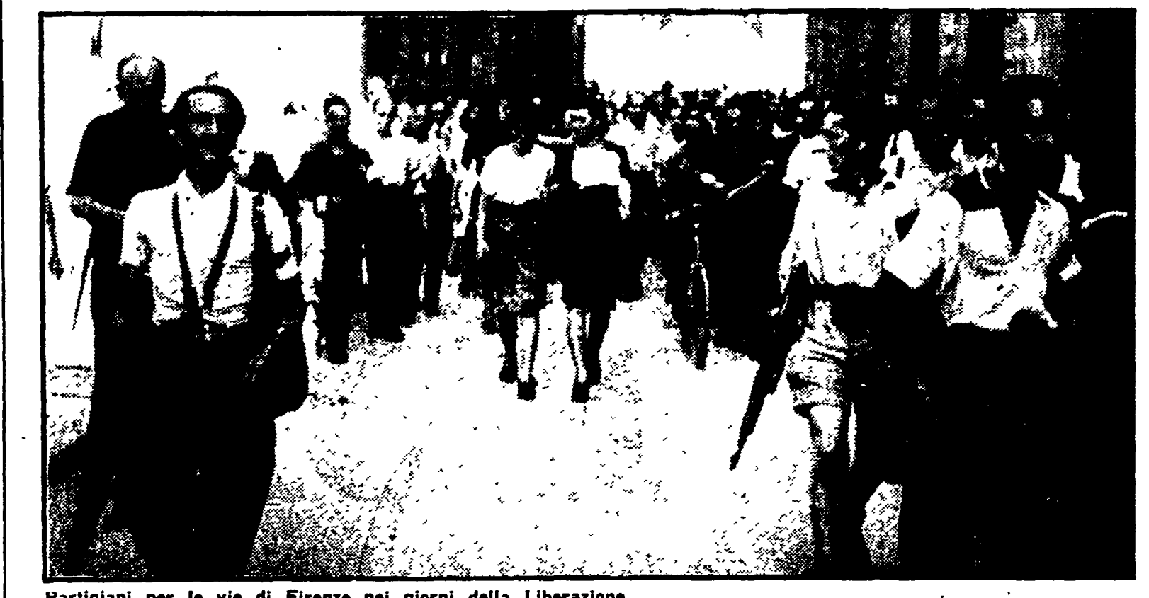
Partigiani per le vie di Firenze nei giorni della Liberazione

Assemblee di cassegrato, di zona e cittadine sono in svolgimento in tutta la Toscana su iniziativa dell'ARCAT (Associazione regionale cooperativa di abitazione toscane aderenti alla Lega). Iniziative si sono già svolte a Firenze, Prato e Pisa, altre si terranno in questi giorni.