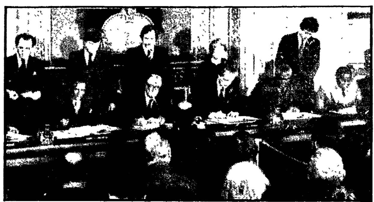
LONDRA — La cerimonia della firma dell'accordo per la Rhodesia

Zimbabwe la calma, la stabilità e lo sviluppo produttivo di cui ha ora assoluto bisogno.