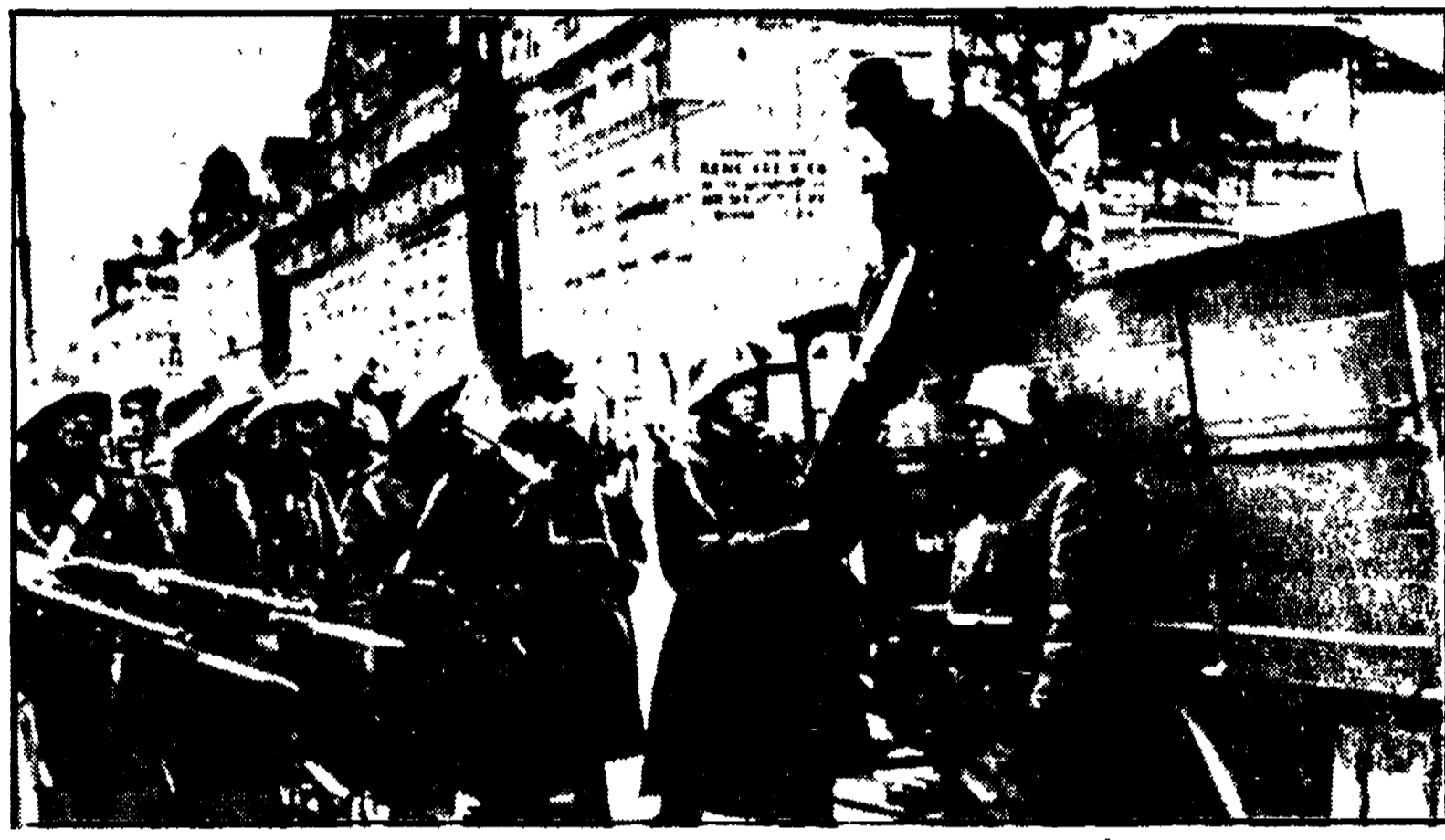
L'esercito interviene contro gli operai viennesi nel Febbraio 1934. Accanto al titolo, Otto Bauer