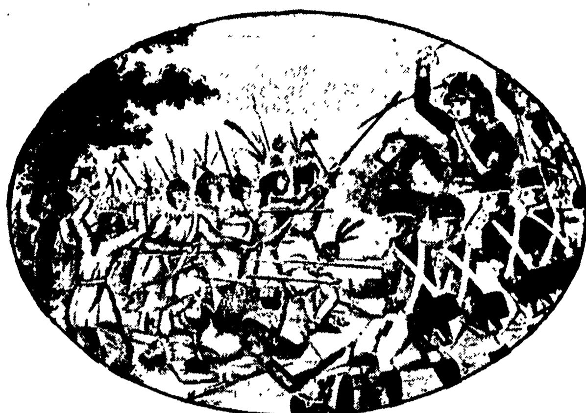
«Hanta-Yo», operazione commerciale made in USA