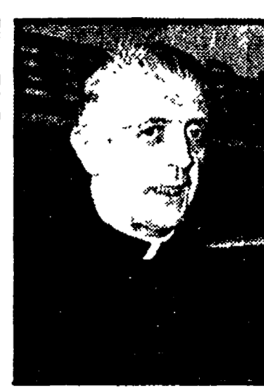
Il cardinale Suenens (a sinistra) che fu grande amico di Giovanni XXIII