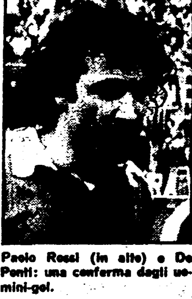
Paolo Rossi (in alto) e De Ponti: una conferma dagli uomini-gol.