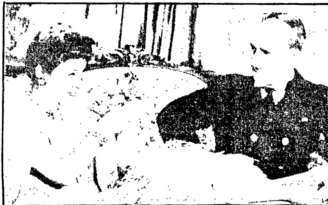
Una scena da «Monsieur Verdoux» di Charlie Chaplin