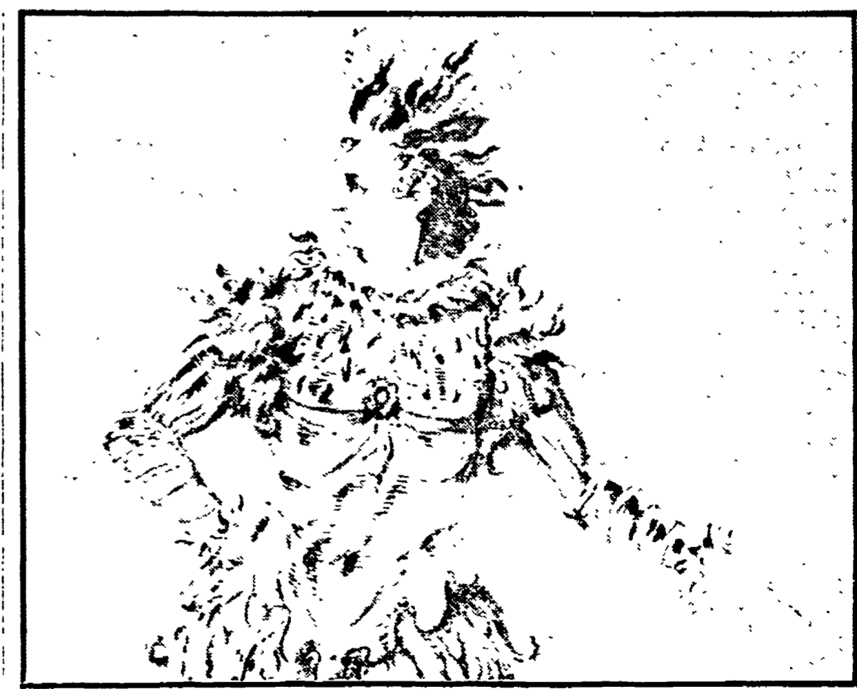
Inigo Jones: costume teatrale