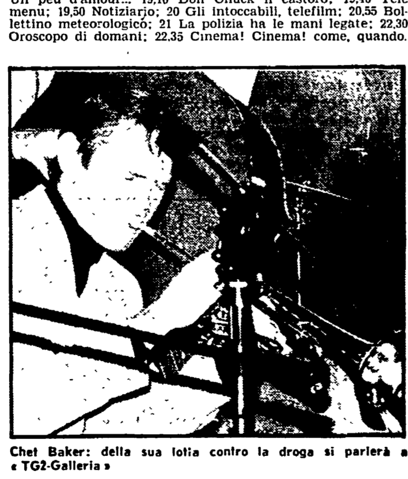
Chet Baker della sua lotta contro la droga si parlerà a « TG2-Galleria »