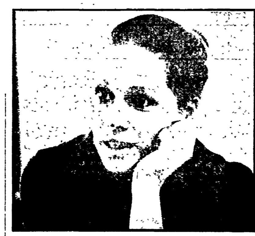
Liv Ullmann è la protagonista del film sulla Rete due

Uno psicopatico evade perironicamente dal carcere in cui è rinchiuso, per compiere efferati crimini. Raccontata così, la trama del film L'assassino arriva sempre alle 10 (Rete due, 21.30), promette una serata agghiacciante. In realtà, si tratta di un film realizzato nel 1972 da Laslo Benedeck con un cast di tutto rispetto: Liv Ullmann, Max Von Sydow, Trevor Howard, Rupert Davies. Nonostante il tema e il clima in cui è immerso, il thriller vuole evitare eccessi horror. Abbiamo visto Max Von Sydow in altre parti di killer gelido come nel Tre giorni del condor. Benedeck, contrassegnato da una fortuna non troppo costante, aveva realizzato Morfe di un commesso viaggiatore e Il viaggio con Martin Brandt.