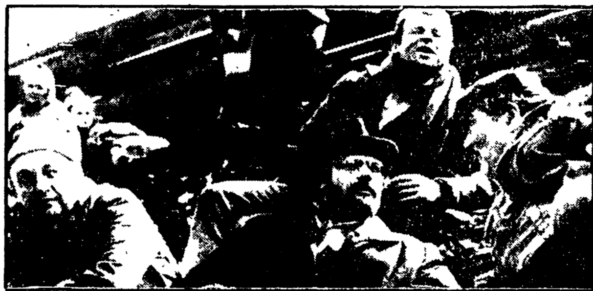
Un' inquadratura del « Compagni », uno dei film di Monicelli che verrà proiettato a Nizza

Dall'11 al 16 marzo una manifestazione allestita per garantire ai nostri film riconoscimenti e diffusione