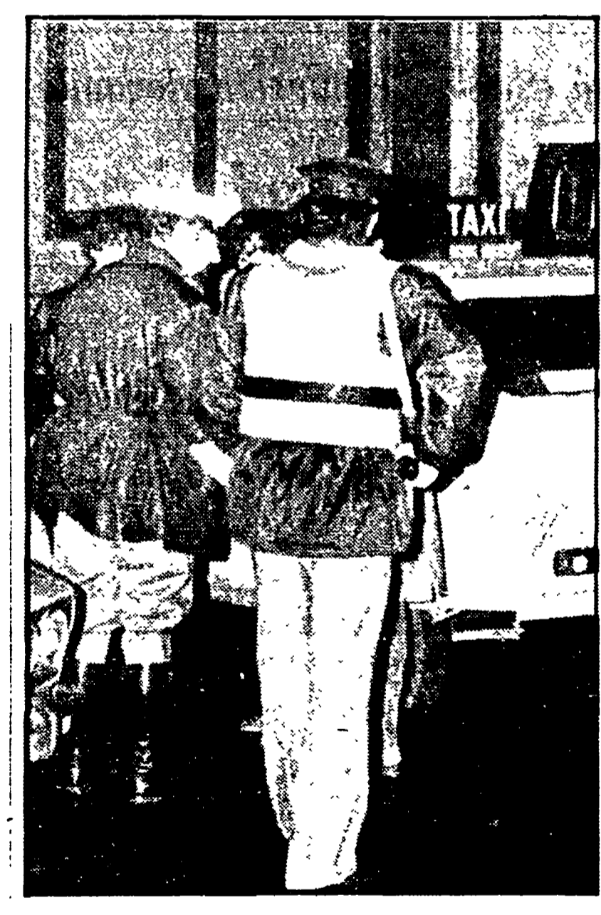
Il bilancio dell'operazione

Sempre più spesso capita all'automobilista di imbattersi in un posto di blocco della polizia o dei carabinieri. Si forma una piccola coda si controllano i documenti. Dopo una breve attesa si riparte. Qualcuno protesta, vorrebbe immediatamente ripartire. Ma questi controlli si rendono necessari per combattere la malavita organizzata e il terrorismo.