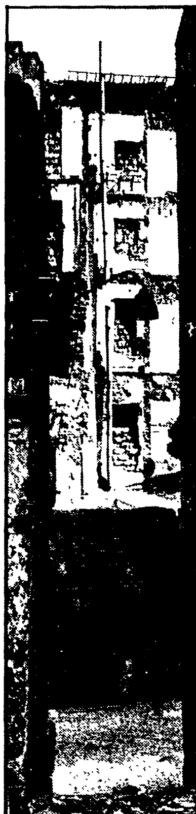
Qui sopra e a lato alcune significative immagini del vecchio centro storico, testimone anch'esso di una Palermo che fu.

Nella cartella anche una litografia — Molti giovani stentano a riconoscere la loro città — I vecchi e i nuovi vandali — Il cemento al posto delle ville