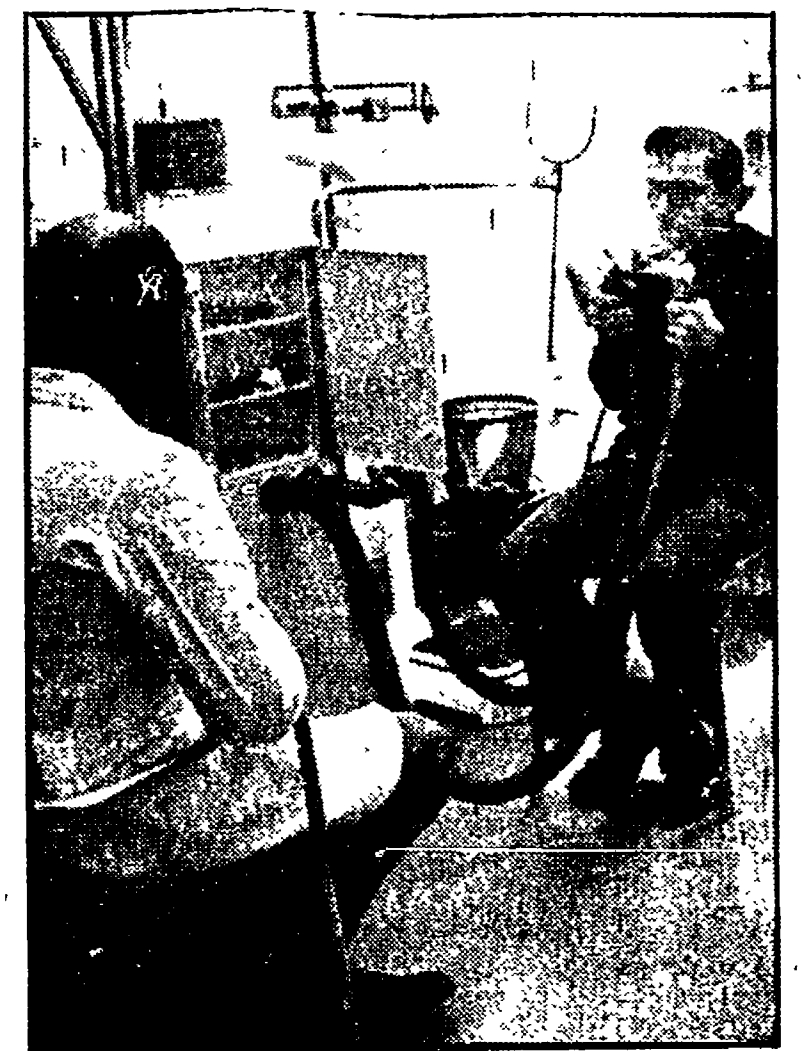
Un operaio si sottopone ad un test medico in un centro di medicina sul lavoro